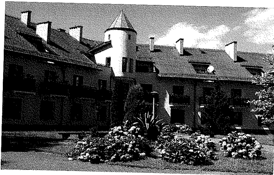
Zdjęcie nr 16. Dom Pomocy Społecznej w Gorzycach