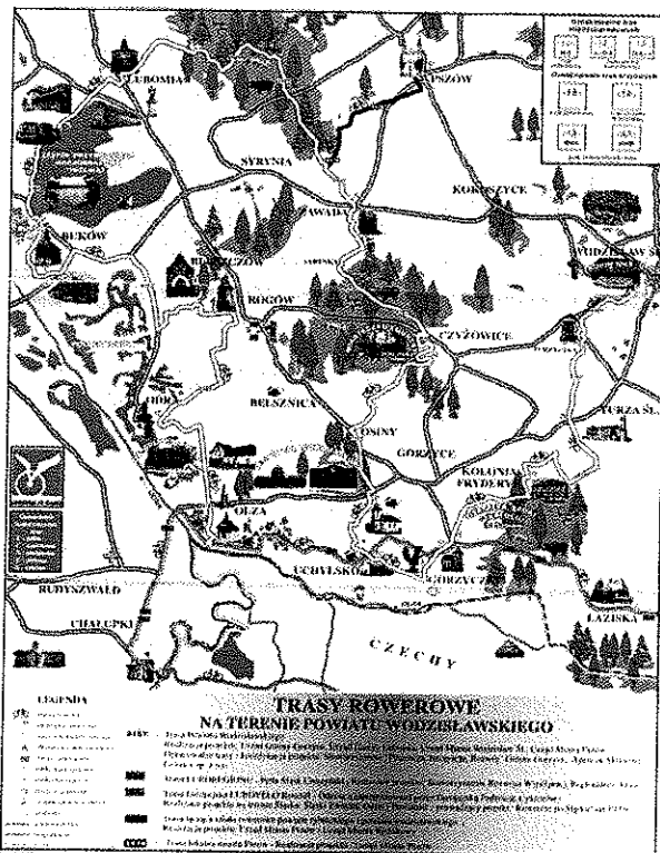
Rysunek nr 8. Trasy rowerowe powiatu wodzisławskiego.

Gorzycy to również popularne miejsce uprawiania turystyki weekendowej. Zalety krajobrazu oraz obiekty zabytkowe zwiedzać można przemierzając rowerem Powiatową Trasę Rowerową 316 Y, która swym zasięgiem obejmuje również Gorzycy. Trasa przebiega z dala od głównych szlaków drogowych tak, aby rowerzyści mogli spokojnie i bezpiecznie z niej korzystać oraz zwiedzać i podziwiać najpiękniejsze zakątki Gorzycy.