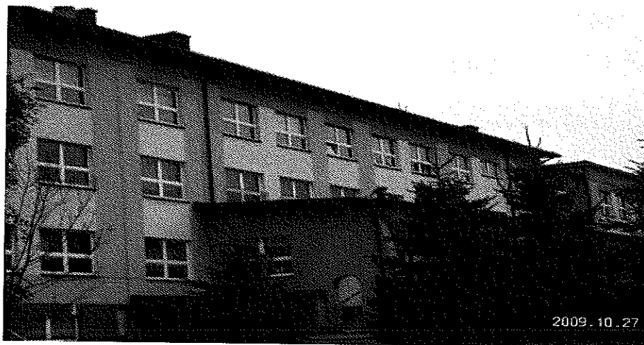
Zdjęcie nr 14. Budynek Szkoły Podstawowej nr 1 w Gorzycach.