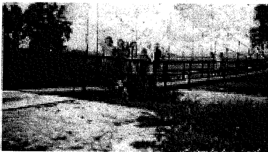
Zdjęcie nr 10 Historyczna kładka na rzece Olzie.

Ponadto realizacja inwestycji pozwoli w przyszłości na połączenie tras rowerowych po stronie polskiej z trasami rowerowymi po stronie czeskiej.