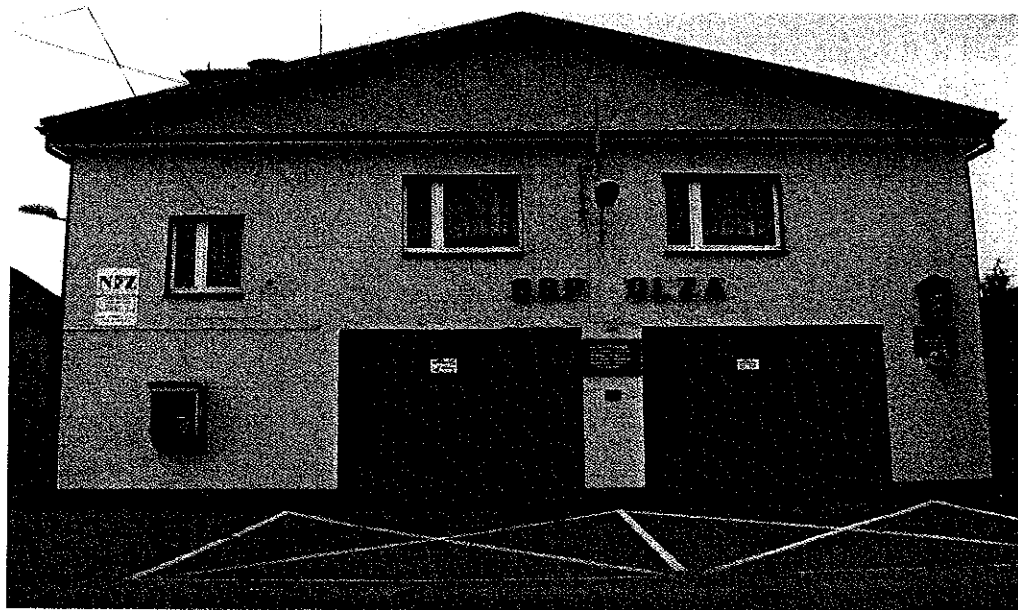
Zdjęcie nr 13 Budynek OSP w Olzie