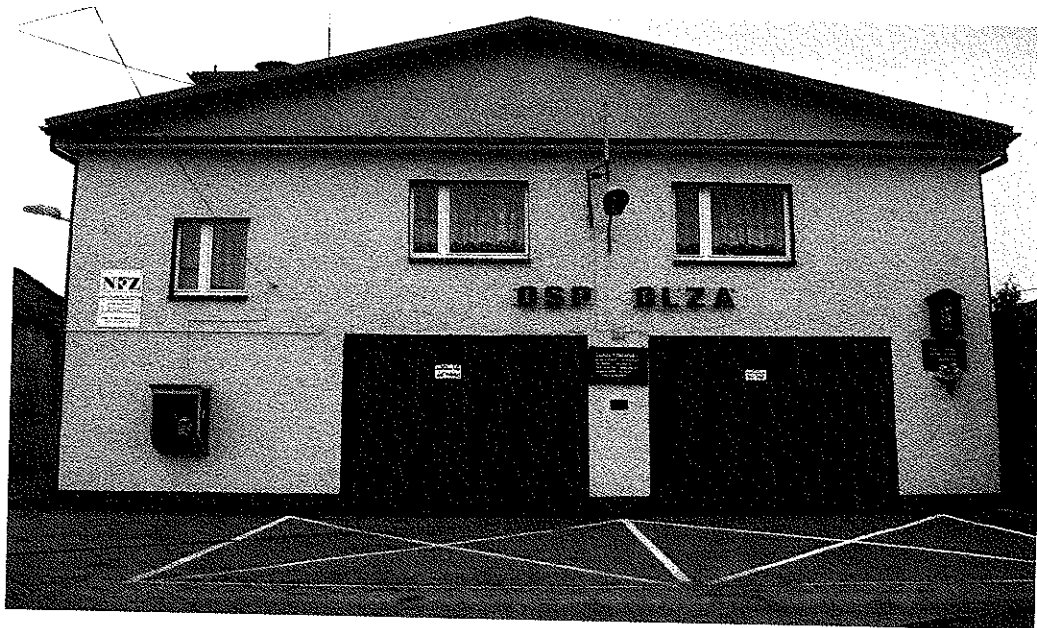
Zdjęcie nr 13 Budynek OSP w Olzie