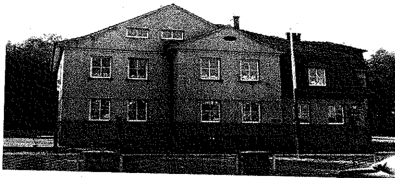
Zdjęcie nr 9. Budynek Szkoły Podstawowej nr 2 w Gorzyczkach przy ul. Leśnej w Gorzyczkach.