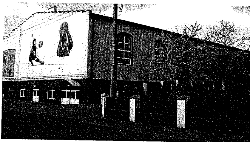
Zdjęcie nr 12. Hala sportowa przy Zespole Szkolno-Przedszkolnym w Gorzyczkach

Oprócz sekcji futsalu klub prowadzi sekcję siatkarską. Zawodnicy Strzelca biorą udział w lokalnych rozgrywkach - Regionalnej Lidze Rybnickiej. Sekcja siatkarska zrzesza 22 zawodników