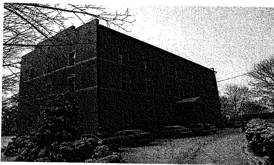
Zdjęcie nr 11. Placówka Powiatowego Domu Dziecka w Gorzyczkach

Działalność placówki może być uzupełniana pracą wolontariuszy. Dodatkowo proces wychowawczy wspomagany jest przez rodziny zaprzyjaźnione. Placówka w Gorzyczkach posiada wyspecjalizowanych trenerów programu „PRIDE Rodzinna opieka zastępcza adopcja”, który ma na celu pozyskiwanie i szkolenie kandydatów na rodziców zastępczych i adopcyjnych dla dzieci pozbawionych czasowo lub trwale opieki rodziców biologicznych. Szkolenia te odbywały się w zależności od potrzeb - nie rzadziej jednak niż raz w roku aktualnie jednak w związku z działalnością Powiatowego Ośrodka Adopcyjno-Opiekuńczego w Gorzyczkach szkolenia realizowane są w ramach zakresu działalności tamtejszego ośrodka. W placówce działa stały Zespół ds. okresowej oceny sytuacji dziecka, który analizuje i ocenia na bieżąco sytuację życiową wychowanka oraz formułuje na piśmie wniosek dotyczący zasadności dalszego pobytu wychowanka w placówce.