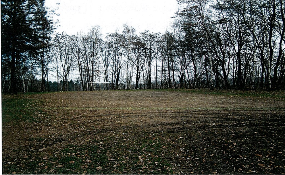
Zdjęcie 11 Boisko „Podgórze”

Mieszkańcy są niezwykle aktywni w podejmowanych przez siebie inicjatywach służących ogółowi. W Bluszczowie prężnie działają organizacje społecznych, w tym: