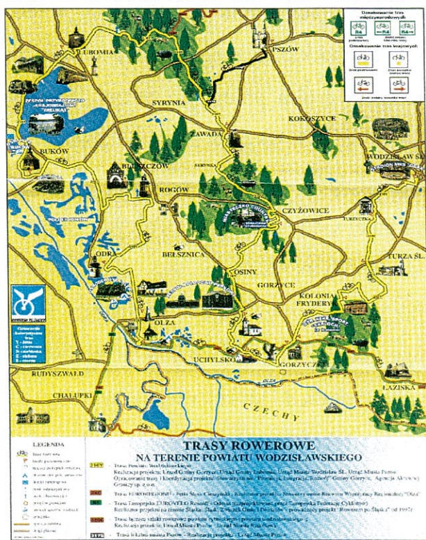
Rysunek 3 Trasy rowerowe powiatu wodzisławskiego.

WODZISŁAW ŚL. - TURZYCZKA - TURZA ŚL. - KOLONIA FRYDERYK - GORZYCZKI - UCHYLSKO - GORZYCE - OSINY - CZYŻOWICE - ZAWADA - PSZÓW - LUBOMIA - BUKÓW - BLUSZCZÓW - ROGOWIEC - ODRA – OLZA.