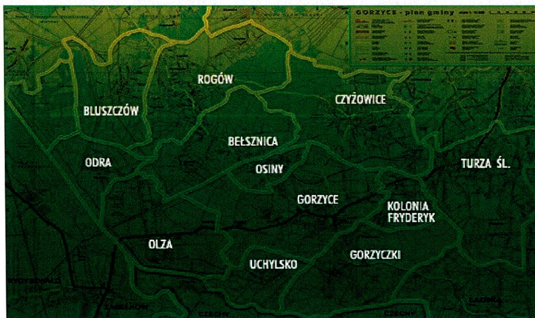
Rysunek nr 2. Plan Gminy Gorzyce