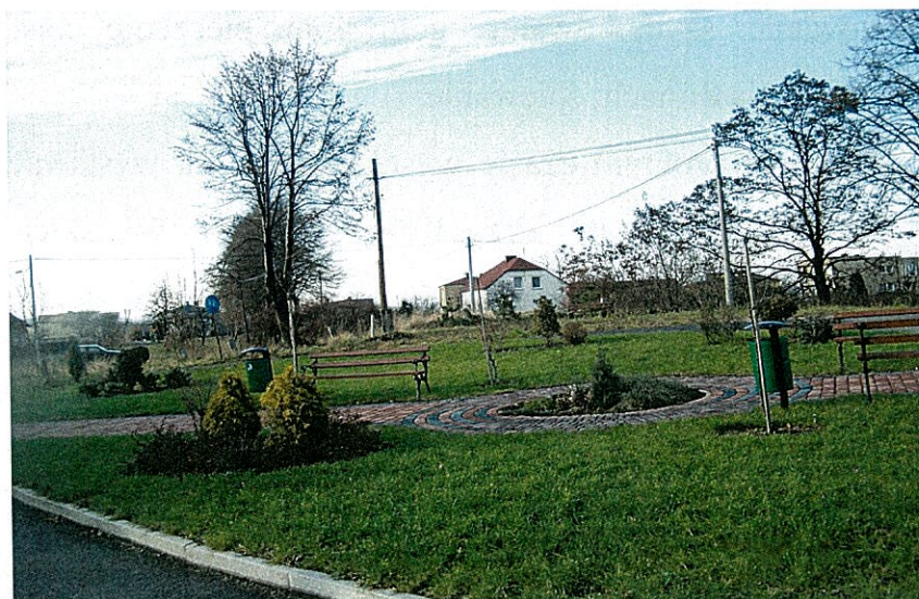
Zdjęcie 12 Skwer przy frakcji kolejowej

Jako doskonały przykład dbałości o własne otoczenie można podać skwer przy frakcji kolejowej. Miejsce, gdzie dobiegała wcześniej droga do nieistniejącego już mostu nad torami, było przez wiele lat niezagospodarowane, porośnięte nieuporządkowaną roślinnością, często zatrzymywały się tam samochody ciężarowe, czyniąc ze skweru miejsce postojowe. Dzięki staraniom mieszkańców oraz władz lokalnych, skwer zagospodarowano (zdjęcie poniżej).