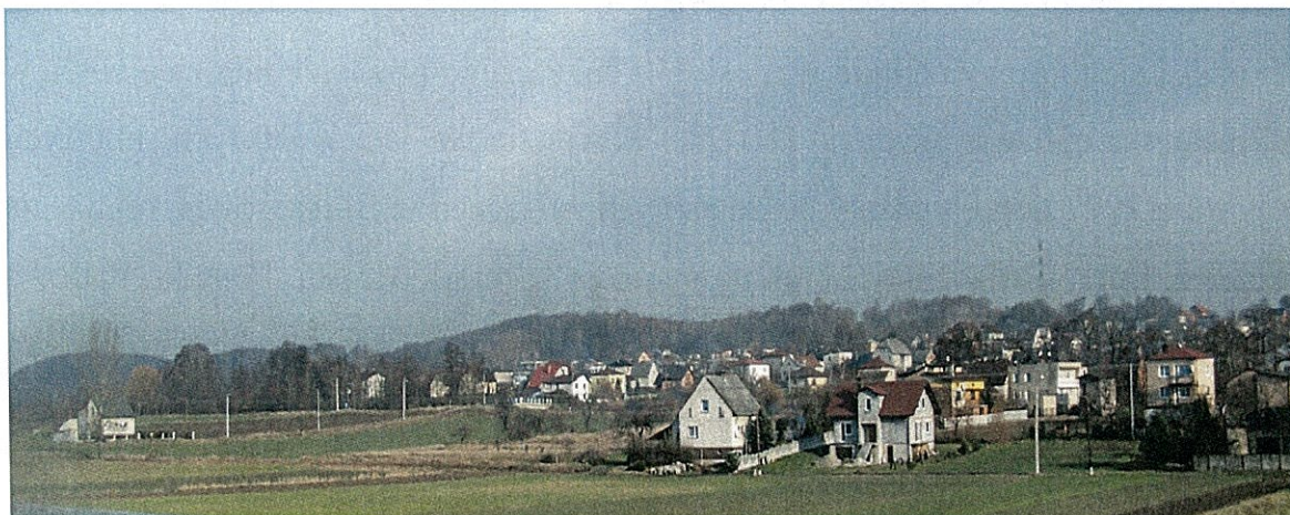
Zdjęcie 7 Widok na miejscowość od strony Polderu Buków

Miejscowość Bluszczów leży w północno-wschodniej części Gminy. Obszar ten (Płaskowyż Rybnicki) cechuje zróżnicowana rzeźba terenu typu pagórkowatego – z wieloma garbami i głęboko wciętymi dolinami (z lokalnymi spadkami nawet powyżej 25 stopni). W kierunku dolin Odry i Olzy Płaskowyż opada dość stromym progiem. Ta część obszaru przedstawia rzeźbę płaskorówninną z licznymi storozeczami i wyrobiskami poźwirowymi wypełnionymi wodą. W Bluszczowie znajdziemy wszystkie ww. elementy rzeźby krajobrazu: w centralnej części teren pagórkowaty, dalej opada w kierunku Polderu Buków.