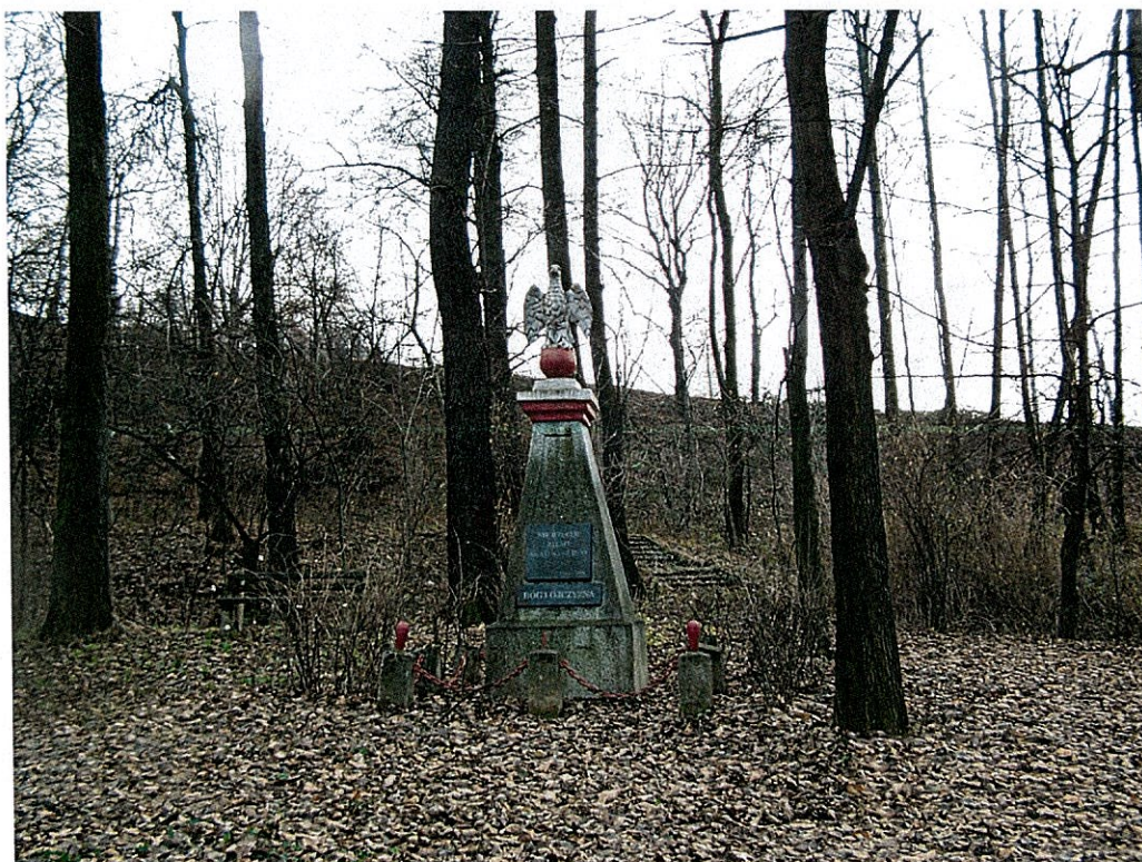
Zdjęcie 6 Pomnik Powstańców Śląskich w Bluszczowie, Park Olszynka