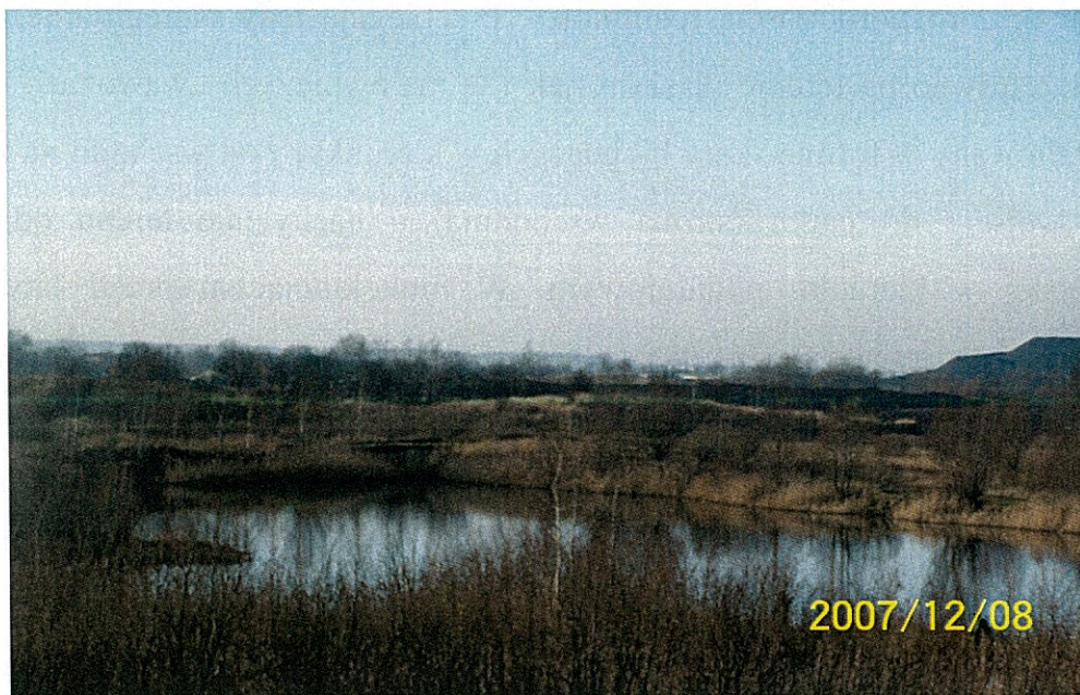
Zdjęcie 1 Jeziora powstałe po wyrobisku żwiru w Bluszczowie