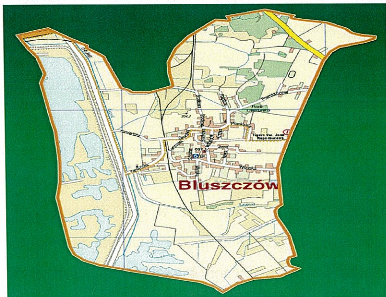
Rysunek nr 1. Plan miejscowości Bluszczów

Miejscowość Bluszczów znajduje się w gminie Gorzyce, zlokalizowanej w południowej części województwa śląskiego przy granicy z Republiką Czeską, w powiecie wodzisławskim. Gmina Gorzyce jest największą terytorialnie gminą powiatu wodzisławskiego, zajmuje 64,47km 2 i stanowi część tzw. „Zielonego Śląska”. Zasoby naturalne gminy stanowią poważny potencjał dla rozwoju branży turystycznej. Ważnym elementem infrastruktury gminy jest wysoko rozwinięta sieć dróg lokalnych. W bliskim sąsiedztwie usytuowany jest ważny węzeł komunikacyjny autostrady A1.