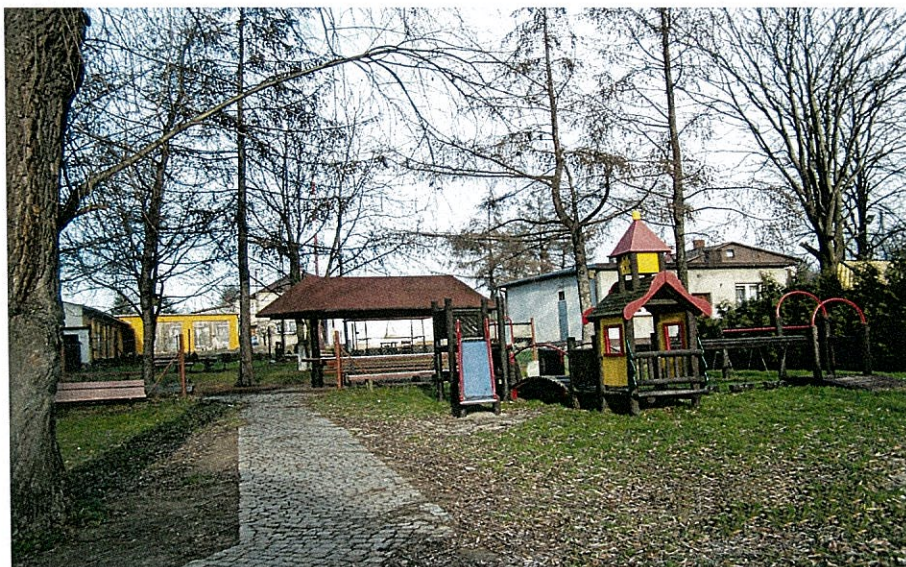
Zdjęcie 9 Plac zabaw w Bluszczowie, w tle zabudowania strażackie

W niedalekiej odległości od szkoły znajduje się plac zabaw graniczący z zabudowaniami straży pożarnej oraz wiata. Pełnią one funkcje komplementarne wobec siebie i stanowią alternatywę dla wypoczywających tam mieszkańców. W pobliżu znajduje się przystanek oraz sklep.