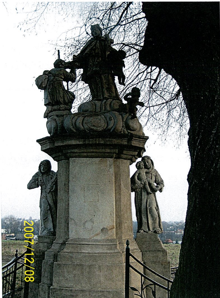
Zdjęcie 2 Figura św. Jana Nepomucena z XVIII w. na wzgórzu Kamieniec w Bluszczowie – widok z cokołem

W samym Bluszczowie znajduje się unikat w skali śląska – kamienna figura św. Jana Nepomucena z XVIII wieku wpisana do rejestru zabytków pod numerem B/585/84. Jest to piękny obiekt małej architektury sakralnej, usytuowany na szczycie wzgórza zwanego Kamieńcem.