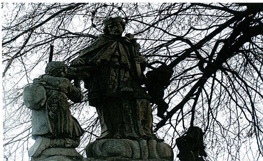
Zdjęcie 3 Figura św. Jana Nepomucena z XVIII w. na wzgórzu Kamieniec w Bluszczowie - rzeźba bez widoku cokołu

Dokładna data powstania figury nie jest znana, datuje się ją na ok. 1730 rok. Jedna z wersji głosi, że figura powstała z fundacji rodziny Larischów, posiadających majątek w Bluszczowie, druga – że figura powstała w roku 1632 za czasów hrabiego Starnhenberga.