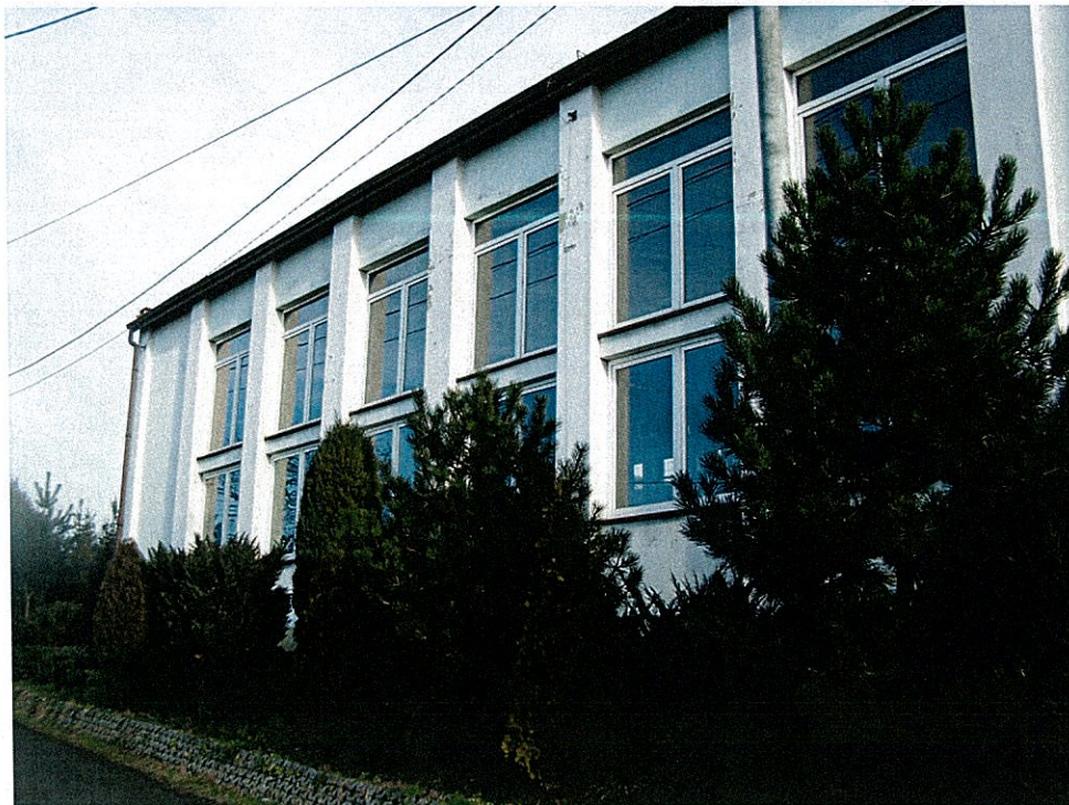
Zdjęcie 10 Hala sportowa przy Szkole Podstawowej w Bluszczowie

Zajęcia sportowe w Bluszczowie odbywają się nie tylko we wspomnianej hali sportowej przy szkole (fot. poniżej), czy boisku szkolnym, ale także na boisku „Podgórze”, znajdującym się w zespole leśnym w pewnym oddaleniu od drogi.