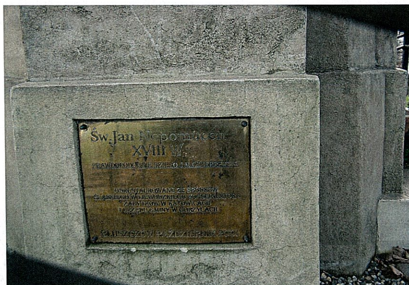
Zdjęcie 4 Tablica pamiątkowa na cokole figury św. Jana Nepomucena z XVIII w. na wzgórzu Kamieniec w Bluszczowie

Dzieło było w złym stanie technicznym. Przez dziesięciolecia niszczało, było odnawiane w sposób nieprofesjonalny. Konieczne było przeprowadzenie konserwacji, rekonstrukcji fragmentów rzeźby oraz uporządkowanie otoczenia. W 2001 roku przeprowadzono gruntowną renowację figury. Prace przeprowadził krakowski konserwator, a współfinansowali je Urząd Gminy w Gorzycach i Wojewódzki Konserwator Zabytków. Obiekt cieszy się rosnącym zainteresowaniem turystów (pod pomnikiem wytyczono ścieżkę rowerową 316Y) oraz pasjonatów sztuki.