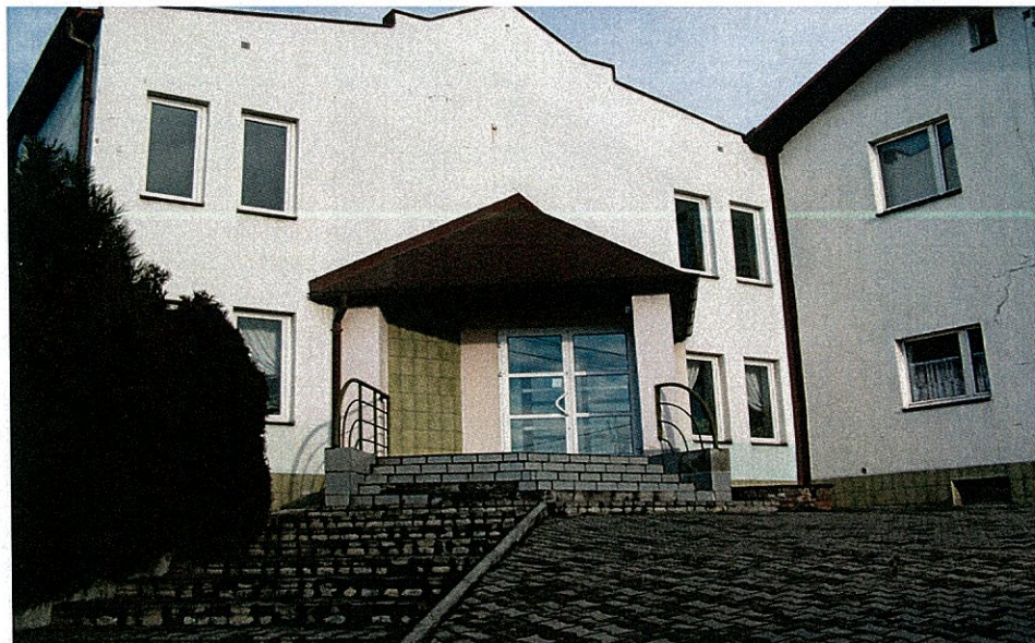
Zdjęcie 8 Szkoła Podstawowa w Bluszczowie

zatrudnionych jest 19 nauczycieli uczących w 6 oddziałach szkolnych (w tym 1 integracyjnym) oraz 2 oddziałach przedszkolnych (w tym 1 integracyjnym). Ponadto 8 osób stanowi personel administracyjno-obługowy.