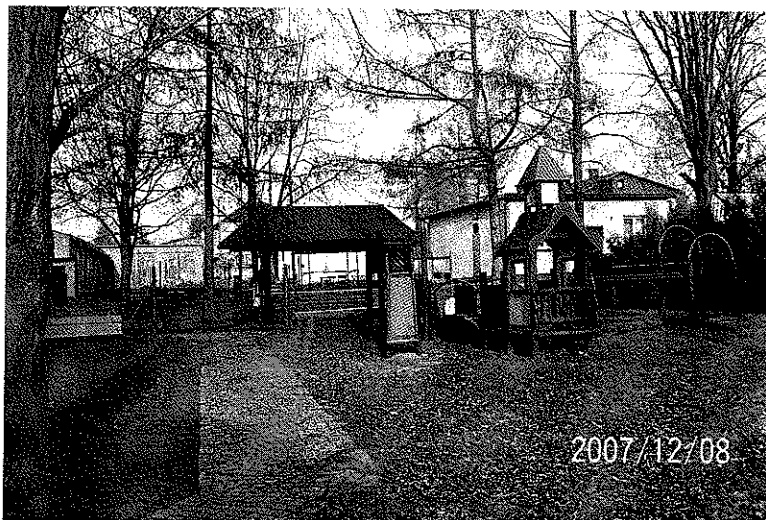
Zdjęcie 10 Plac zabaw w Bluszczowie, w tle zabudowania strażackie

istniejącego placu zabaw, w zabudowaniach, którymi gospodarują strażacy powstała świetlica wiejska. Sąsiedztwo obu miejsc spowoduje ich komplementarność wobec siebie i będą one stanowić alternatywę dla wypoczywających tam mieszkańców.