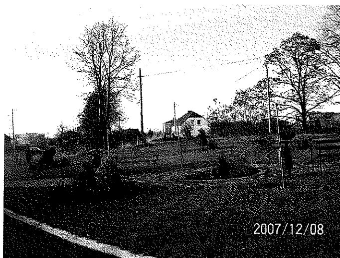
Zdjęcie 13 Skwer przy frakcji kolejowej

Aktywność mieszkańców można również mierzyć pozytywną rywalizacją, jaka powstała w sferze zagospodarowywania własnych ogródków przydomowych oraz skwerków na terenach publicznych. Obejścia domów w Bluszczowie charakteryzują się wyróżniającą się estetyką. Cecha ta dotyczy prawie wszystkich działek i stanowi poważny atut miejscowości.