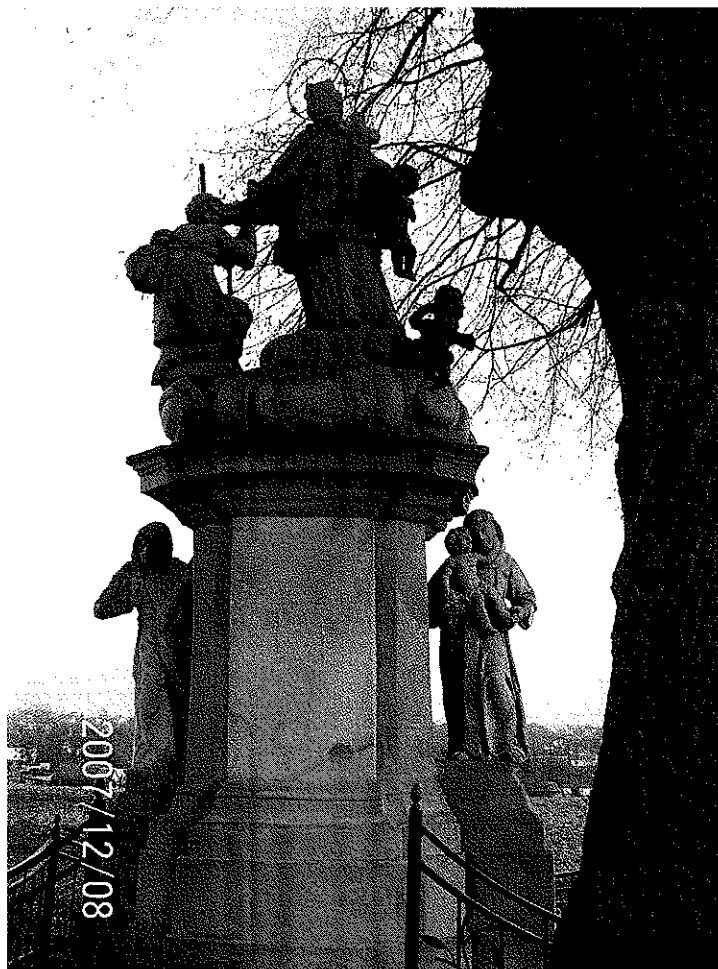
Zdjęcie 2 Figura św. Jana Nepomucena z XVIII w. na wzgórzu Kamieniec w Bluszczowie – widok z cokołem

Ze wspomnianym wzgórzem wiążą się liczne legendy m.in. o pojedynku dwóch braci oraz o rozbójnikach mających w pobliskiej Ligotce zameczek połączony podziemnym tunelem ze szczytem Kamieńca.