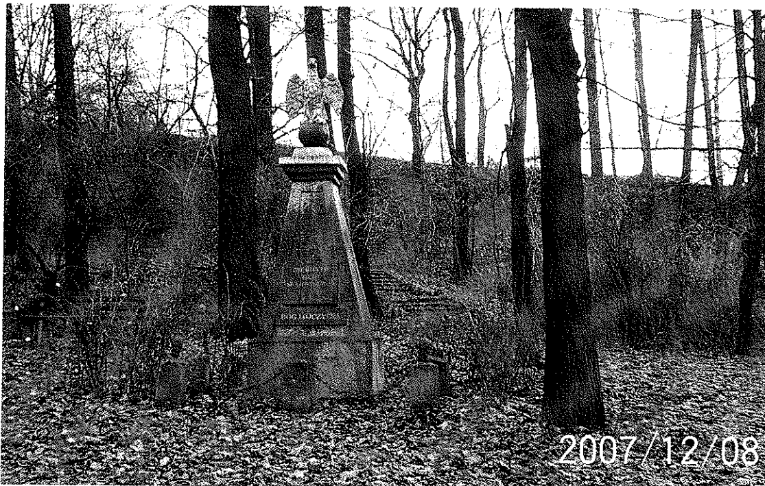
Zdjęcie 6 Pomnik Powstańców Śląskich w Bluszczowie, Park Olszynka