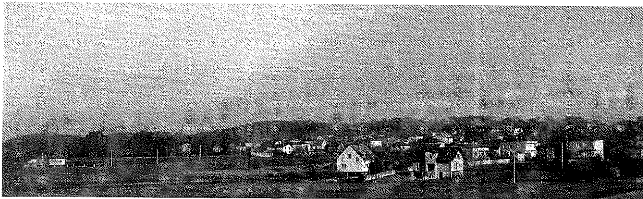
Zdjęcie 7 Widok na miejscowość od strony Polderu Buków

Miejscowość Bluszczów leży w północno-wschodniej części Gminy. Obszar ten (Płaskowyż Rybnicki) cechuje zróżnicowana rzeźba terenu typu pagórkowatego – z wieloma garbami i głęboko wciętymi dolinami (z lokalnymi spadkami nawet powyżej 25 stopni). W kierunku dolin Odry i Olzy Płaskowyż opada dość stromym progiem. Ta część obszaru przedstawia rzeźbę płaskorówninną z licznymi storozeczami i wyrobiskami poźwirowymi wypełnionymi wodą. W Bluszczowie znajdziemy wszystkie ww. elementy rzeźby krajobrazu: w centralnej części teren pagórkowaty, dalej opada w kierunku Polderu Buków.