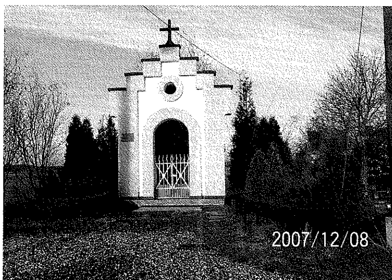
Zdjęcie 5 Kaplice przydrożne w Bluszczowie

Poza tym w Parku Olszynka znajduje się pomnik Powstańców Śląskich, który upamiętnia wydarzenia z roku 1921, kiedy na terenie Bluszczowa doszło do jednej z najkrwawszych bitew w trakcie trzeciego powstania śląskiego - wpisany do miejsc pamięci województwa śląskiego pod nr 59/05.