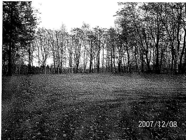
Zdjęcie 12 Stadion leśny w Bluszczowie

siatkarskich. Otaczające tereny są własnością gminy, mogą pomieścić dużą liczbę ludności. Stadion w chwili obecnej wymaga remontu, m.in. wymiany bramek, rekonstrukcji nawierzchni z trawy i zagospodarowania otoczenia.