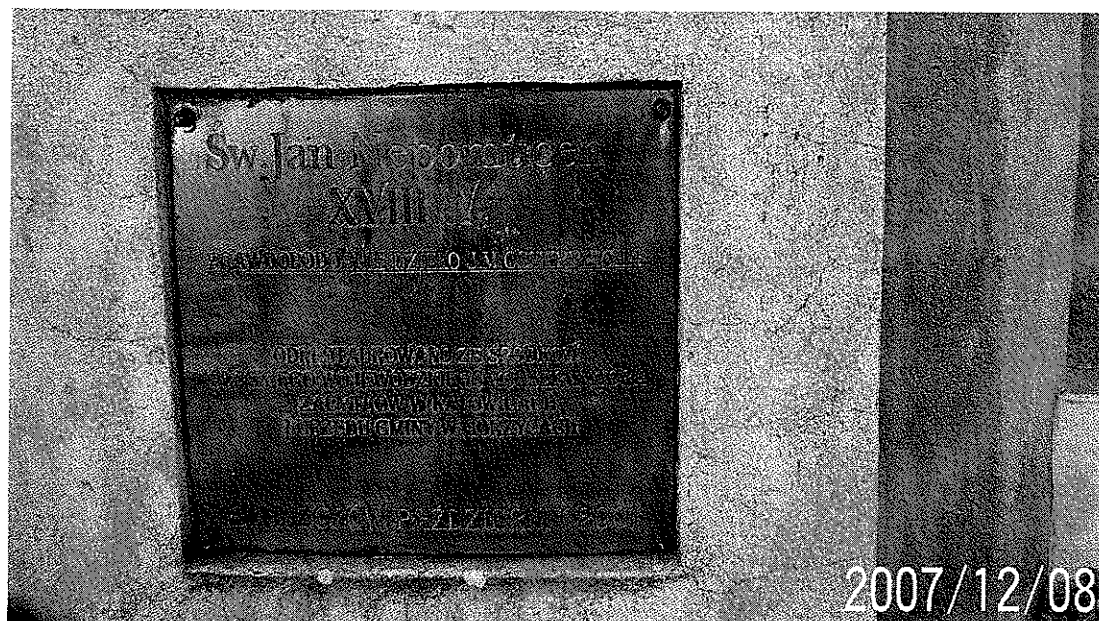
Zdjęcie 4 Tablica pamiątkowa na cokole figury św. Jana Nepomucena z XVIII w. na wzgórzu Kamieniec w Bluszczowie

Ponadto Gmina Gorzyce może poszczycić się wieloma zabytkowymi kaplicami, cmentarzami i krzyżami przydrożnymi. W Bluszczowie spotkamy dwa zabytkowe krzyże przydrożne przy ulicy Powstańców i Wiejskiej. Ponadto dwie kaplice na ulicy Kamieńskiej i Powstańców.