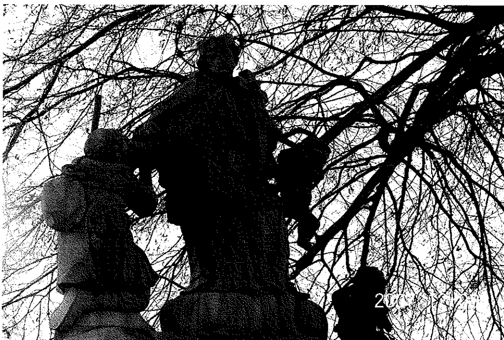
Zdjęcie 3 Figura św. Jana Nepomucena z XVIII w. na wzgórzu Kamieniec w Bluszczowie - rzeźba bez widoku cokołu

Dokładna data powstania figury nie jest znana, datuje się ją na ok. 1730 rok. Jedna z wersji głosi, że figura powstała z fundacji rodziny Larischów, posiadających majątek w Bluszczowie, druga – że figura powstała w roku 1632 za czasów hrabiego Starnhenberga.