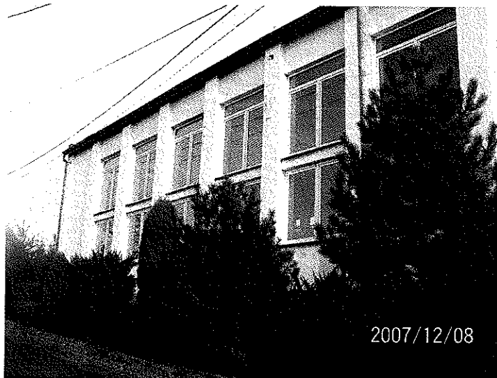
Zdjęcie 11 Hala sportowa przy Szkole Podstawowej w Bluszczowie

Zajęcia sportowe w Bluszczowie odbywają się nie tylko we wspomnianej hali sportowej przy szkole (fot. poniżej), czy boisku szkolnym, ale także na wiejskim „stadionie”, znajdującym się w zespole leśnym w pewnym oddaleniu od drogi.