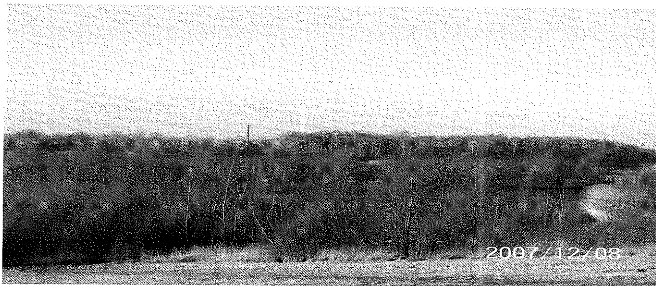
Zdjęcie 8 Polder Buków

Odry – Bierawka. Na terenie całej gminy sieć wodna jest gęsta, za sprawą zlewisz dwóch dużych rzek – Olzy przepływającej wzdłuż południowej granicy i Odry – wzdłuż zachodniej. Ponadto przez Turzę Śląską przepływa Leśnica. Na całym obszarze występują gęsto potoki oraz naturalne i antropogeniczne jeziora. Ważną cechą hydrologiczną rzek są stoiny wód, które prowadzą do powodzi. Wały ochronne nie zawsze stanowią skuteczną zaporę przeciw wylewom rzek. Przewidywany do budowy zbiornik Racibórz, istotny w planowanym systemie ochrony doliny rzeki Odry, zrealizowany fragmentarycznie w postaci Polderu Buków poprawił sytuację w Gminie Gorzyce. Jego powierzchnia wynosi 830 ha, z czego powierzchnia zalewowa w okresie napełnienia wynosi 710 ha. Powodzie w latach 70-tych i 80-tych i w roku 1997 doprowadzały do znacznych zniszczeń w Bluszczowie, realizacja Polderu Buków znacznie poprawiła sytuację w miejscowości. Ponadto budowa polderu jest formą rekultywacji i rewaloryzacji terenów zdewastowanych wcześniejszą eksploatacją kruszywa.