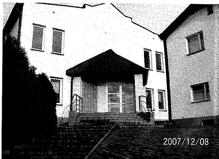
Zdjęcie 9 Szkoła Podstawowa w Bluszczowie

W sołectwie Bluszczów można zauważyć działania rady sołectkiej i mieszkańców w kierunku ukształtowania centralnej przestrzeni kulturalnej i rekreacyjno-sportowej w okolicach szkoły podstawowej. Szkoła jest wyposażona w nowoczesną salę gimnastyczną oraz zewnętrzne boisko sportowe. Hala sportowa i boisko są ogólnie dostępne dla dzieci, młodzieży i dorosłych mieszkańców. Tu m.in. trenuje miejscowy zespół piłkarski „Strzelec”, odbywają się Turnieje Miast i Gmin. W szkole działa aktywnie świetlica, której ręczne wyroby są wysoko cenione w okolicy (np.: makiety, dekoracje, karty świąteczne itp.). Miejskowa szkoła podstawowa jest jedyną na terenie gminy placówką, gdzie stworzono warunki nauki dla dzieci niepełnosprawnych w ramach oddziałów integracyjnych.