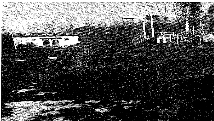
Zdjęcie nr 7. Oczyszczalnia ścieków w Belsznicy

Miejscowość Belsznica jest skanalizowana w około 35 % , jednak w Wieloletnim Planie Inwestycyjnym Gminy Gorzyce założono rozbudowę kanalizacji sanitarnej w sołectwie Belsznica w najbliższych latach. Po zakończeniu realizacji założonych inwestycji w zakresie kanalizacji w 2011 roku, Belsznica będzie sołectwem skanalizowanym w około 90%.