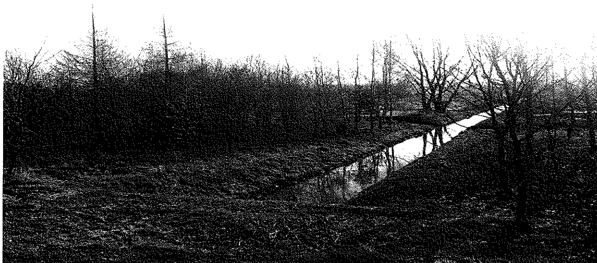
Zdjęcie nr 5. Potok Łęgoń w Belsznicy

Głównymi rzekami odwadniającymi region rybnicko-wodzisławski są: Odra, Olza, Piotrówka, Leśnica i Szotkówka, jak również Ruda z Nacyną i prawobrzeżny dopływ Odry – Bierawka. Na terenie całej gminy sieć wodna jest gęsta, za sprawą zlewisk dwóch dużych rzek – Olzy przepływającej wzdłuż południowej granicy i Odry – wzdłuż zachodniej. Na całym obszarze występują gęsto potoki oraz naturalne i antropogeniczne jeziora. Ważną cechą hydrologiczną rzek są stoiny wód, które prowadzą do powodzi. Przez wieś Belsznica w jej południowej części przepływa niewielki potok Łęgoń.