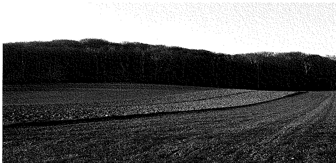
Zdjęcie nr 6. Walory krajobrazowe sołectwa Belsznica

Ssaki reprezentowane są przez: sarny, lisy, zające, kuny oraz dziki.