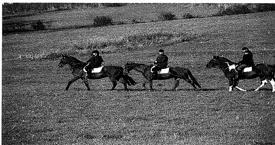
Zdjęcie nr 9. Ośrodek Jazdy Konnej w Belsznicy.

Ze względu na powierzchnię jaką zajmuje sołectwo Belsznica nie można jednoznacznie uznać tego regionu Gminy Gorzyce za atrakcyjny turystycznie. Miejscem związanym z turystyką jest boisko lokalnego klubu sportowego. Miejsce to jest jednym z obiektów w Gminie Gorzyce na którym odbywają się duże imprezy plenerowe. Na obiekcie tym odbyły się m.in gminne dożynki oraz Dni Gminy Gorzyce. Należy również nadmienić, że na terenie Belsznicy działają dwa ośrodki jazdy konnej, które w ramach swojej działalności świadczą usługi dla okolicznych mieszkańców, a także świadczą usługi związane z gospodarką agroturystyczną.