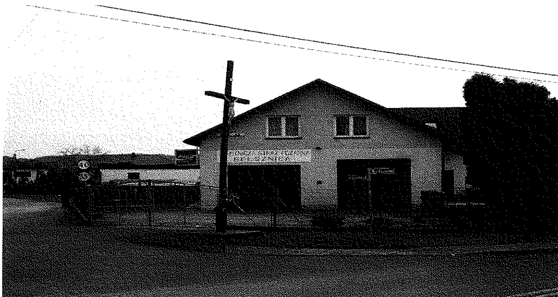
Zdjęcie nr 8. Budynek OSP w Belsznicy