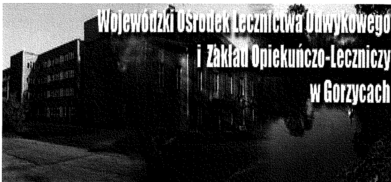
Zdjęcie nr 17. WOŁO i ZOL w Gorzycach