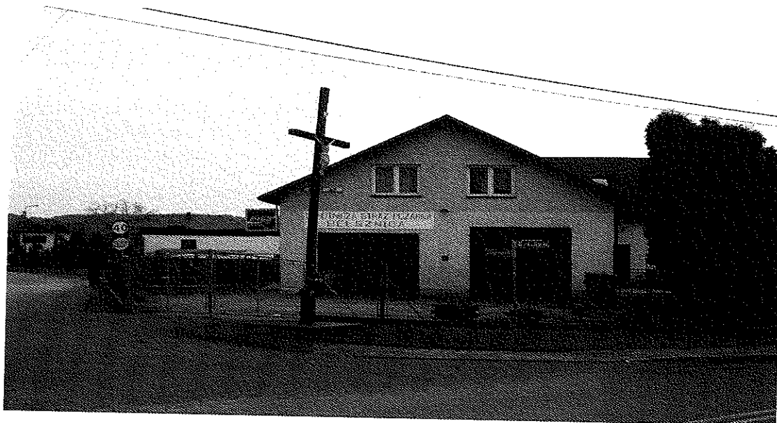
Zdjęcie nr 8. Budynek OSP w Belsznicy