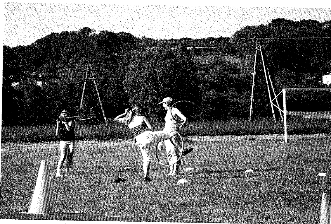
Zdjęcie nr 10 Teren sąsiadujący z miejscem lokalizacji przedmiotowego projektu

Plac zabaw będzie zlokalizowany na terenie stanowiącym własność Gminy Gorzyce, w niedalekim sąsiedztwie boiska sportowego.