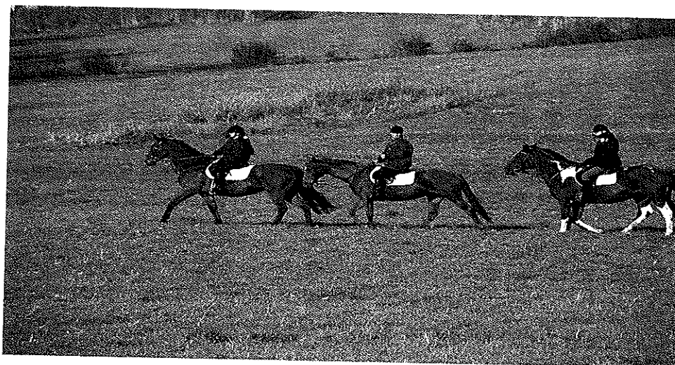
Zdjęcie nr 9. Ośrodek Jazdy Konnej w Belsznicy.

Ze względu na powierzchnię jaką zajmuje sołectwo Belsznica nie można jednoznacznie uznać tego regionu Gminy Gorzyce za atrakcyjny turystycznie. Miejscem związanym z turystyką jest boisko lokalnego klubu sportowego. Miejsce to jest jednym z obiektów w Gminie Gorzyce na którym odbywają się duże imprezy plenerowe. Na obiekcie tym odbyły się m.in gminne dożynki oraz Dni Gminy Gorzyce. Należy również nadmienić, że na terenie Belsznicy działają dwa ośrodki jazdy konnej, które w ramach swojej działalności świadczą usługi dla okolicznych mieszkańców, a także świadczą usługi związane z gospodarką agroturystyczną.