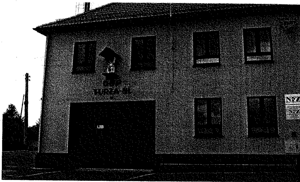
Zdjęcie nr 13. Budynek OSP w Turzy Śląskiej

kłęk żywiolowych oraz służy pomocą mieszkańcom sołectwa w różnych okolicznościach jeżeli jest taka potrzeba.