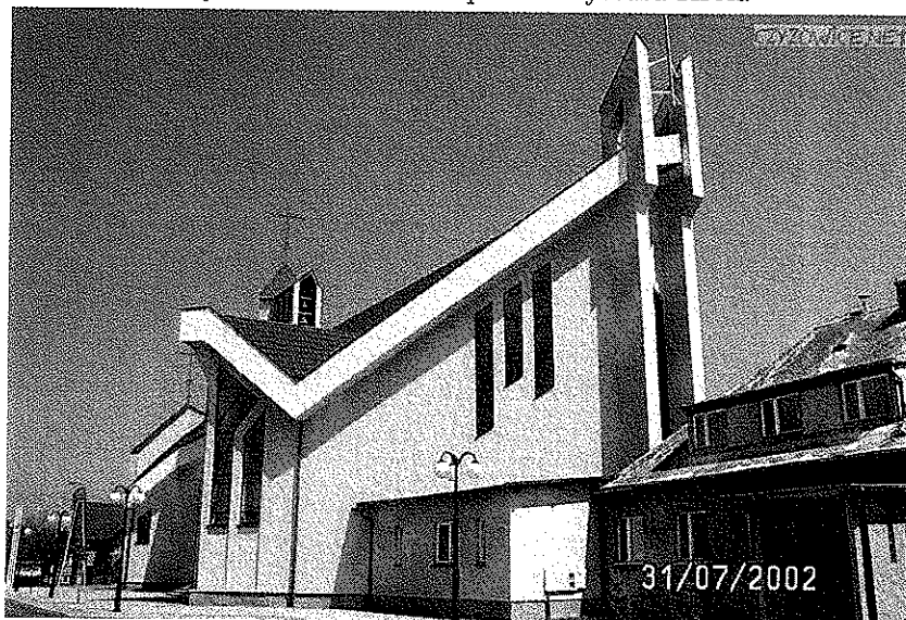
Rysunek 2.1: Kościół p.w. Chrystusa Króla