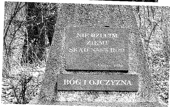
Zdjęcie 18 i 19 Pomnik powstańców - tablica pamiątkowa i orzeł na szczycie pomnika