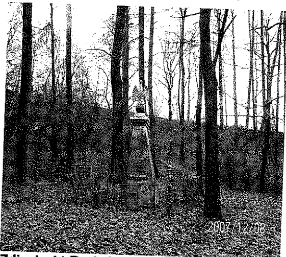
Zdjęcie 14 Park Olszynka widok na pomnik, parkowe w tle za pomnikiem schody i płyta amfiteatru

Park ma charakter leśny z zróżnicowanym ukształtowaniem terenu oraz różnorodnością (w tym szczególnie cennych) drzew i krzewów. Przez przedmiotowy teren przebiegają nieregularne, wąskie alejki, zarówno na terenie płaskim, jak i w malowniczych „wąwozach”. Na fotografiach poniżej można zobaczyć elementy dawnego zagospodarowania oraz zabytkowy, pochodzący z 1928 roku pomnik poświęcony Powstańcom Śląskim. Pomnik oraz jego otoczenie wymagają renowacji. Jednocześnie zasadne jest przeprowadzenie prac rewitalizacyjnych na terenie całego parku wraz z jego zagospodarowaniem