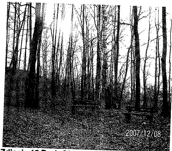
Zdjęcie 15 Park Olszynka, stare ławki