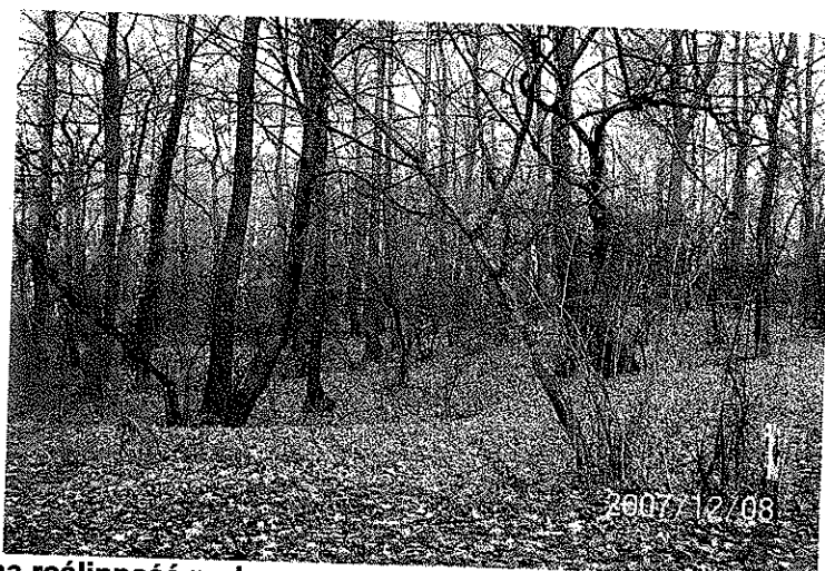
Zdjęcie 17 Widok na roślinność parkową

Głównym założeniem do projektu zieleni „Parku Olszynka” jest zachowanie jego naturalnego, leśnego charakteru przy jednoczesnym zapewnieniu funkcjonalności, stworzeniu warunków do dobrego wypoczynku i podniesieniu walorów estetycznych miejsca.