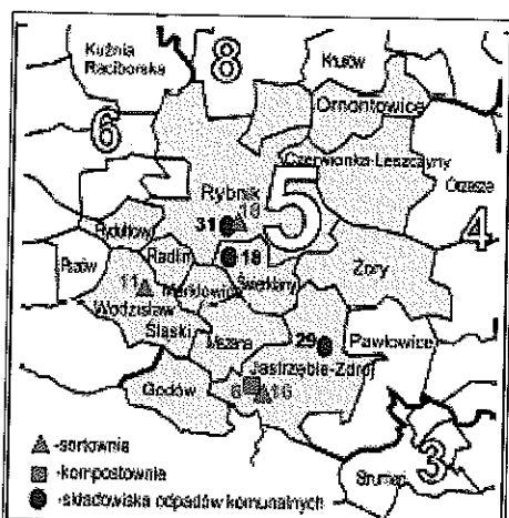
Rys. 6. Planowany Region 5 (według WPGO 2010 dla Województwa Śląskiego 2010)

Poniżej przedstawiono planowany Region 5 w którym Gmina Gorzyce rozważa członkostwo z uwagi na fakt iż większość odpadów komunalnych z terenu gminy trafia na składowisko w Jastrzębiu Zdroju.