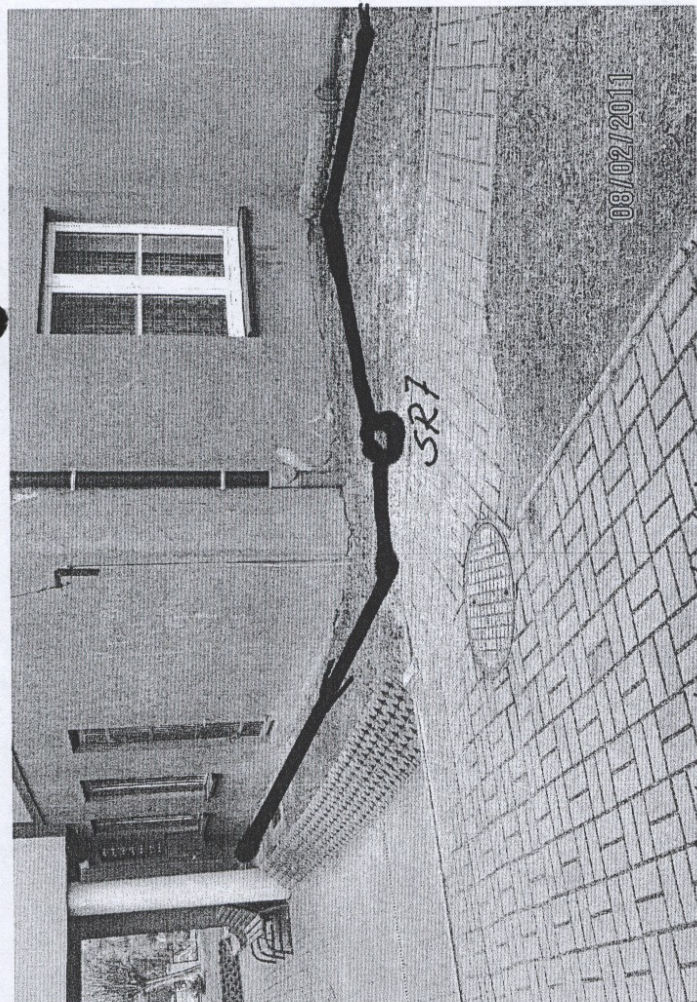
naroznik str. potudnično-úšhodnej