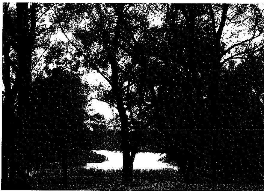
Zdjęcie nr 4. Walory przyrodnicze Odry.