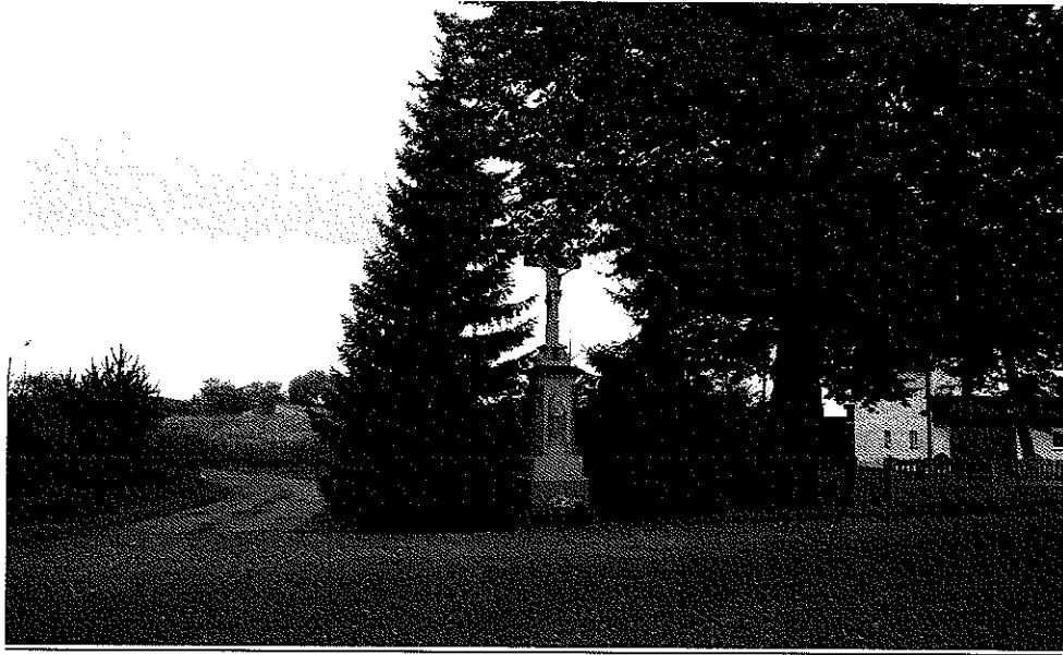
Zdjęcie nr 2. Krzyż przydrożny przy ulicy Głównej w sołectwie Odra

Na terenie wsi znajduje się rozległa żwirownia założona w roku 1905, gdy odkryto że płytko pod powierzchnią ziemi znajdują się grube złoża bardzo wartościowego żwiru i tak w 1905 r. niemiecka firma postanowiła otworzyć żwirownię. Przez cały okres żwirownia prężnie działała a jedynie zmieniali się właściciele. Ostatecznie żwirownia zakończyła swoją eksploatację jako przedsiębiorstwo państwowe w roku 2001 pozostawiając po sobie krajobraz księżycowy w postaci hałd ziemi. W naniesionych żwirach spotyka się czasem zęby, kręgi, czy inne kości mamuta i pnie dębów sprzed wielu tysięcy lat. Zalewy po wydobyciu żwiru wykorzystywane są jako tereny rybackie i wędkarskie. Dawniej koryto rzeki Odry biegło tuż obok wsi, przesunięto je kilkadziesiąt lat temu.