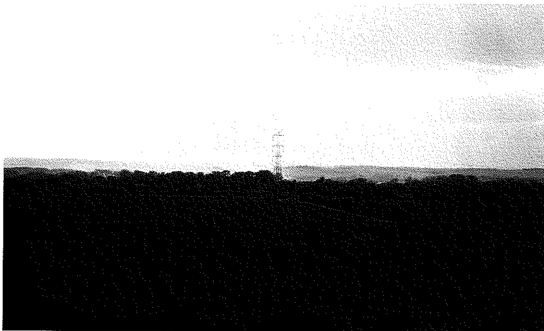
Zdjęcie nr 5. Widok na sołectwo z rogowskich wzgórz.

Miejscowość Odra usytuowana w zachodniej części Gminy, na terenie starego koryta Odry, przy głównej drodze (łączącej dwie główne drogi: Wodzisław Śl. – Racibórz oraz Wodzisław Śl. – Chałupki), biegnącej wzdłuż Odry i jej rozlewisk. Granicę północną sołectwa wyznacza sztuczny zbiornik „Polder Buków”. Miejscowość charakteryzuje teren równinny i poprzecinany jest szeregiem zbiorników poźwirowych.