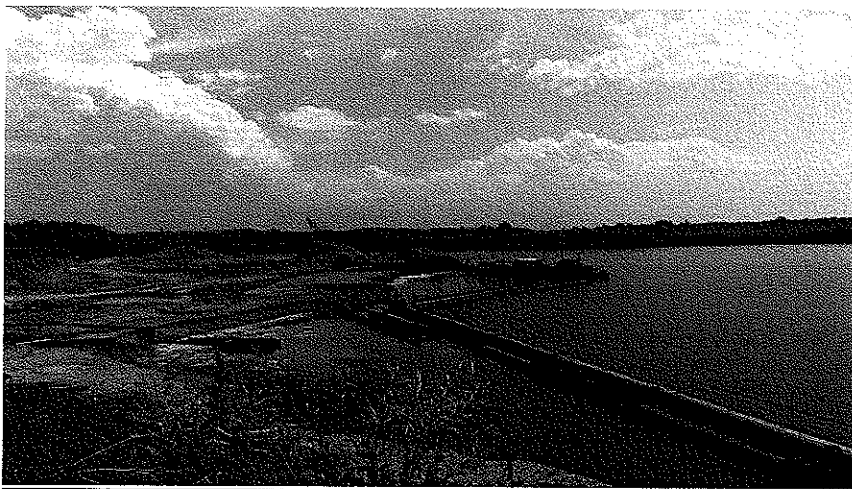
Zdjęcie nr 3. Archiwalne zdjęcie żwirowni w Odrze.

Na terenie wsi znajduje się rozległa żwirownia założona w roku 1905, gdy odkryto że płytko pod powierzchnią ziemi znajdują się grube złoża bardzo wartościowego żwiru i tak w 1905 r. niemiecka firma postanowiła otworzyć żwirownię. Przez cały okres żwirownia prężnie działała a jedynie zmieniali się właściciele. Ostatecznie żwirownia zakończyła swoją eksploatację jako przedsiębiorstwo państwowe w roku 2001 pozostawiając po sobie krajobraz księżycowy w postaci hałd ziemi. W naniesionych żwirach spotyka się czasem zęby, kręgi, czy inne kości mamuta i pnie dębów sprzed wielu tysięcy lat. Zalewy po wydobyciu żwiru wykorzystywane są jako tereny rybackie i wędkarskie. Dawniej koryto rzeki Odry biegło tuż obok wsi, przesunięto je kilkadziesiąt lat temu.