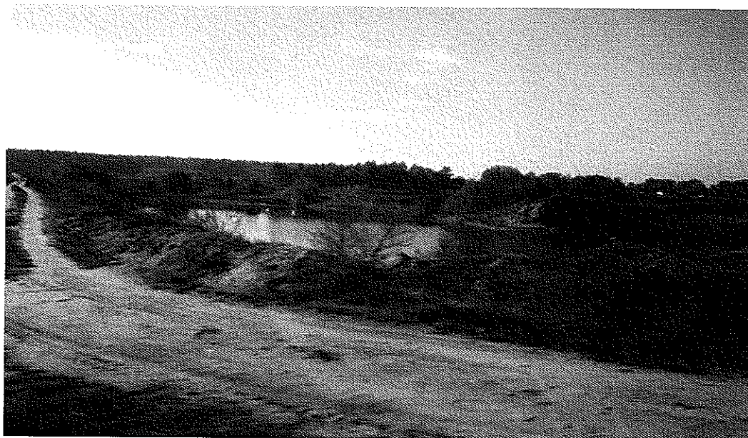
Zdjęcie nr 6. Wyrobiska poźwirowe w Odrze

Sołectwo Odra charakteryzuje się gęstą siecią zbiorników wodnych pochodzenia antropogenicznego tj. wypełnione czystą wodą wyrobiska poźwirowe. Zbiorniki te posiadają silnie rozwiniętą linię brzegową oraz znaczne głębokości. Są one pozostałością po działających na tym terenie żwirowniach, które działały na dziesiątkach hektarów. Teren Odry jest bardzo ciekawy pod względem krajobrazowym i cieszy się dużym powodzeniem wśród wędkarzy z powiatów wodzisławskiego, raciborskiego. Duże powierzchnie akwenów wodnych powodują, że sołectwo narażone jest na liczne powodzie. W historii najbardziej zapisała się powódź z 1997 r. W północnej części sołectwa możemy napotkać wały przeciwpowodziowe sztucznego zbiornika „POLDER BUKÓW” .