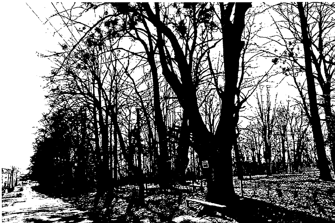
Ilustracja 36: Gorzycki - założenie parkowe.

Zarówno drzewa jak i krzewy są w dobrym stanie zdrowotnym. Zespół zieleni parku posiada dużą wartość zabytkową, historyczną i artystyczną w skali regionu. W celu utrzymania charakteru parku niezbędne jest wykonywanie sukcesywnie i systematycznie prac sanitarnych i pielęgnacyjnych przy drzewostanie. Ze względu na licznie występujący samosiew niezbędne jest wykonanie szczegółowej inwentaryzacji dendrologicznej, programu gospodarki zielenią oraz projektu rewaloryzacji opracowanego w oparciu o materiały archiwalne pisane i ikonograficzne. Na tej podstawie można będzie przystąpić do rewaloryzacji parku uwzględniającej zarówno jego walory historyczne jak i współczesne potrzeby. Niezależnie od tych działań wartość zabytkowa predystynuje kompleks wraz z pałacem do objęcia ochroną na mocy gminnej i wojewódzkiej ewidencji zabytków. W trzeciej ćwierci XIX wieku obok dworu w stylu klasycystycznym powstaje folwark. Podobnie jak w wielu innych przypadkach budynki gospodarcze otrzymują otoczkę zieleni wysokiej. Do dziś zachowały się jedynie pojedyncze egzemplarze dębów szypułkowych, lip drobnolist-