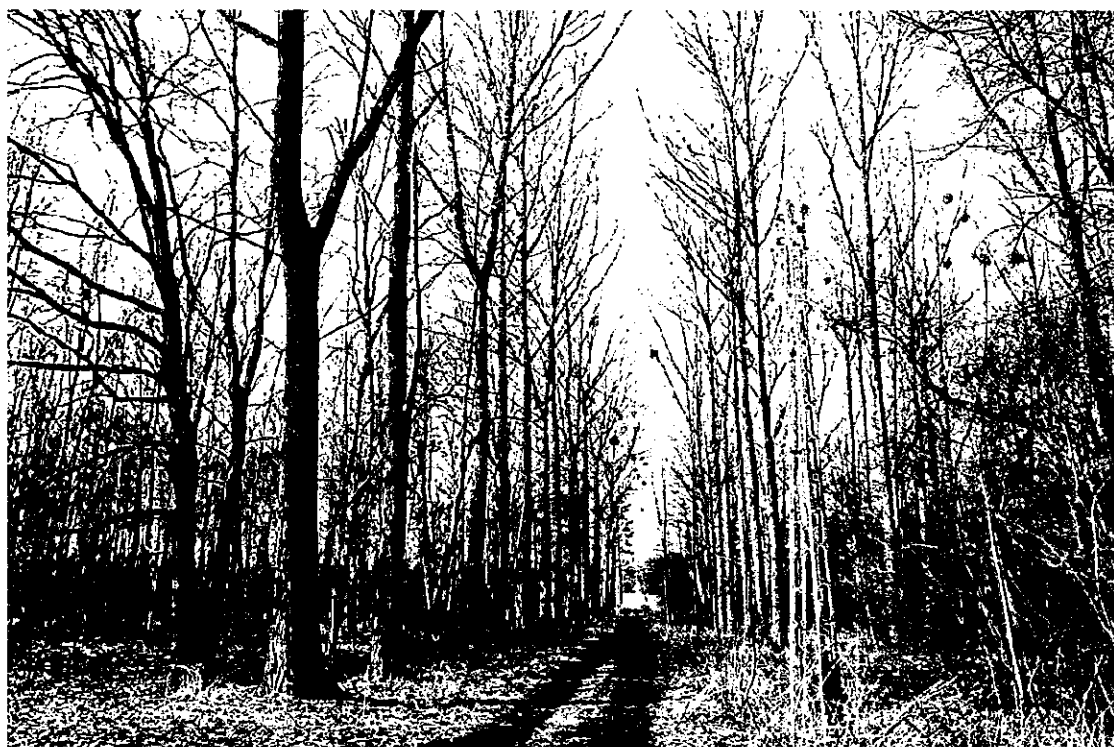
Ilustracja 37: Gorzyce - tereny parku pałacowego.

Można zatem przypuszczać, że w tym czasie, tj. w połowie XIX wieku zakomponowano całość założenia parkowego. Kompozycja ta została oparta na rozległych wnętrzach parkowych w typie polan widokowych oraz /w pobliżu pałacu/ mniejszych salonach oraz gabinetach. W ich obrębie, zgodnie z zasadami kształtowania swobodnych kompozycji krajo- brazowych wpisywano grupy lub pojedyncze egzemplarze drzew introdu- kowanych egzotycznych i rodzimych. Były to platany klonolistne, buki zwyczajne odmiany purpurowej, choiny kanadyjskie, wiązy grabolistne i górskie, klony czerwone, kasztanowce białe, robinie akacjowe, dęby błotne, tulipanowce amerykańskie i wiele innych. Prawdopodobnie z tym etapem tworzenia kompozycji należy wiązać ukształtowanie malownicze- go stawu na północny zachód od pałacu, powiązanego z nim duktem wi- dokowym. W tym samym czasie powstają również dwie główne aleje ob- sadzone szpalerami dębów szypułkowych. Kolejnym etapem rozwoju parku było uzupełnienie kompozycji o krótką aleję lip drobnolistnych