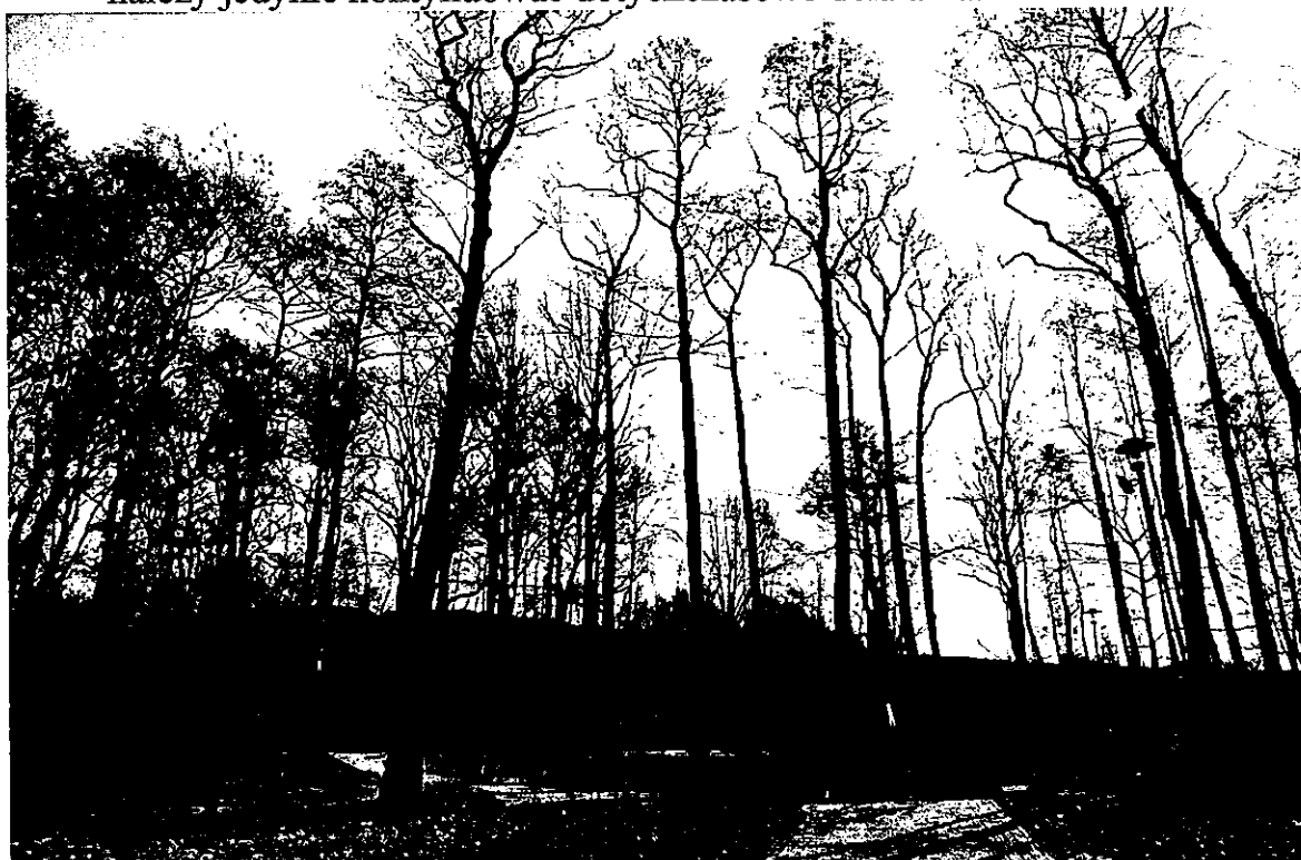
Ilustracja 39: Bluszczów - park "Olszynka".

droflory dębów szypułkowych (obecnie o średnicach od 45 do 65 cm) określono nazwę parku. Jest to niewielki obszar o charakterze leśnym, bez zdecydowanej formy kompozycyjnej. Po usytuowaniu w obrębie parku pomnika oraz elementów małej architektury parkowej zieleni uzupełniono o pojedyncze nasadzenia modrzewi europejskich, żywotników zachodnich, cisów pośrednich, oraz śliw purpurowych. Obecnie, dzięki systematycznie prowadzonym na jego terenie pracom stan dendroflory można uznać za zadowalający. W celu jego utrzymania na obecnym poziomie należy jedynie kontynuować dotychczasowe działania.