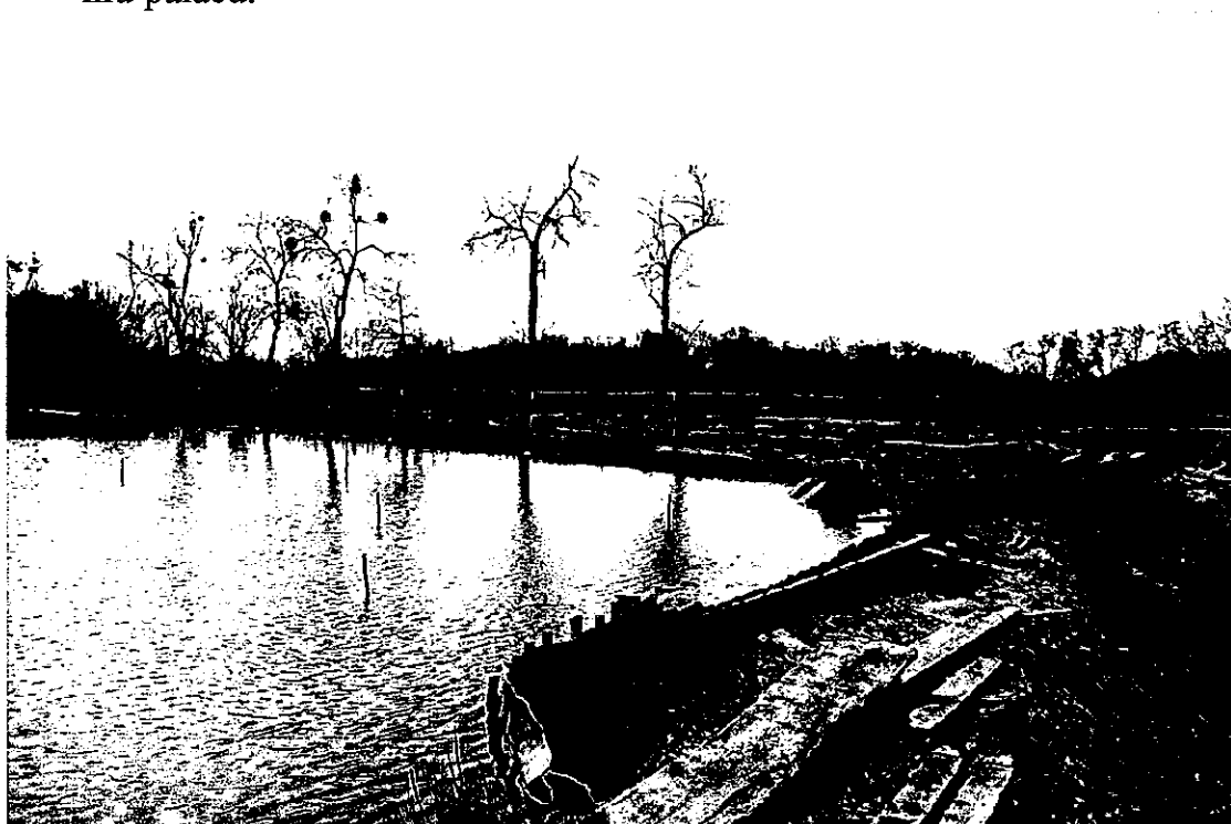
Ilustracja 38: Gorzyce - stawy rybne na terenie parku pałacowego.

przy pałacyku, szpaler lip drobnolistnych i jesionów wyniosłych przy obecnej ulicy Zamkowej oraz stworzenie zespołu stawów użytkowo - rekreacyjnych w północnej części założenia. O ich włączeniu w kompozycję parku świadczą towarzyszące im systemy grobli obsadzonych dębami szypułkowymi. Działania te podjęto najprawdopodobniej już po ukończeniu pałacu.