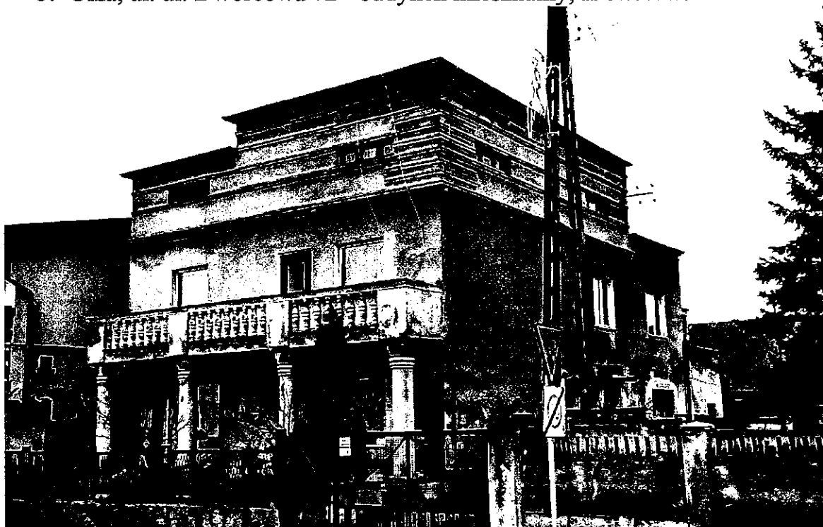
Ilustracja 35: Rogów, ul. Raciborska 28.