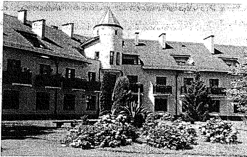
Zdjęcie nr 16. Dom Pomocy Społecznej w Gorzycach