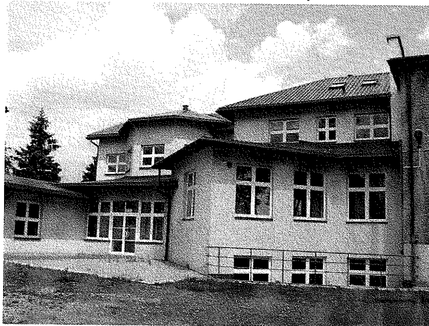
Rysunek 2.14: Budynki szkoły