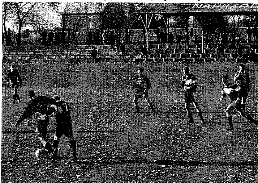
Rysunek 2.17: Rozgrywki LKS „Naprzód Czyżowice“