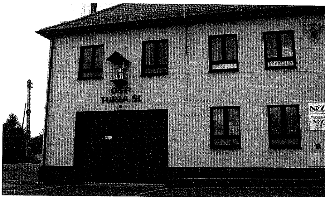
Zdjęcie nr 13. Budynek OSP w Turzy Śląskiej

klęsk żywiołowych oraz służy pomocą mieszkańcom sołectwa w różnych okolicznościach jeżeli jest taka potrzeba.