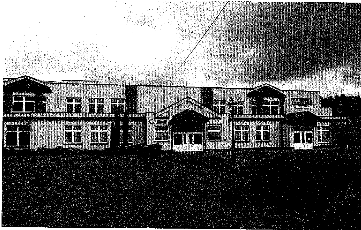
Zdjęcie nr 12. Budynek Szkoły Podstawowej i Gimnazjum w Turzy Śląskiej.

Do obwodu gimnazjum należą uczniowie z Turzy Śl., z Olzy i Odry (dojeżdżający ok. 9 km). Według danych 1.09.2009 r. naukę rozpoczęło 211 gimnazjalistów. Dodatkowo do gimnazjum uczęszczają uczniowie z okolicznych miejscowości – Gorzyc, Gorzyczek, Rogowa, Bluszczowa, Krostoszowic i Wodzisławia Śląskiego. Budynek szkoły jak i gimnazjum jest nowy, przestronny i dobrze wyposażony. W roku 2000 dokonano podziału szkoły i wyodrębniono osobną część dla gimnazjum i dla szkoły podstawowej. W budynku zlokalizowane są klasopracownie przedmiotowe, pracownia komputerowa, biblioteka multimedialna, świetlica. Zarówno szkoła podstawowa jak i gimnazjum posiadają wspólną salę gimnastyczną z zapleczem w postaci salki korekcyjnej i siłowni a od 2008 r. również boiska sportowe.