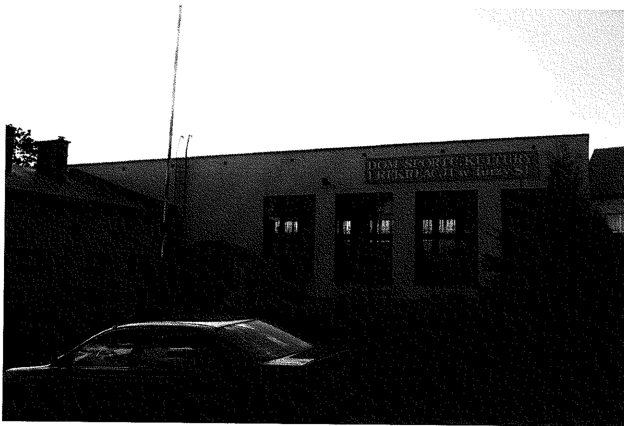
Zdjęcie nr 14. Budynek Domu Sportu, Kultury i Rekreacji w Turzy Śląskiej.