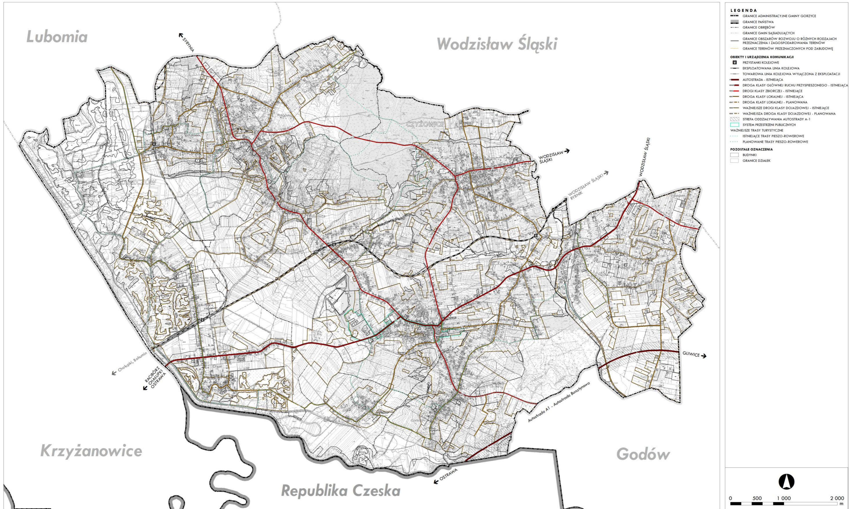
Schemat nr 3. Kierunki rozwoju systemu komunikacji drogowej, kolejowej, rowerowej i pieszej; opracowanie własne.