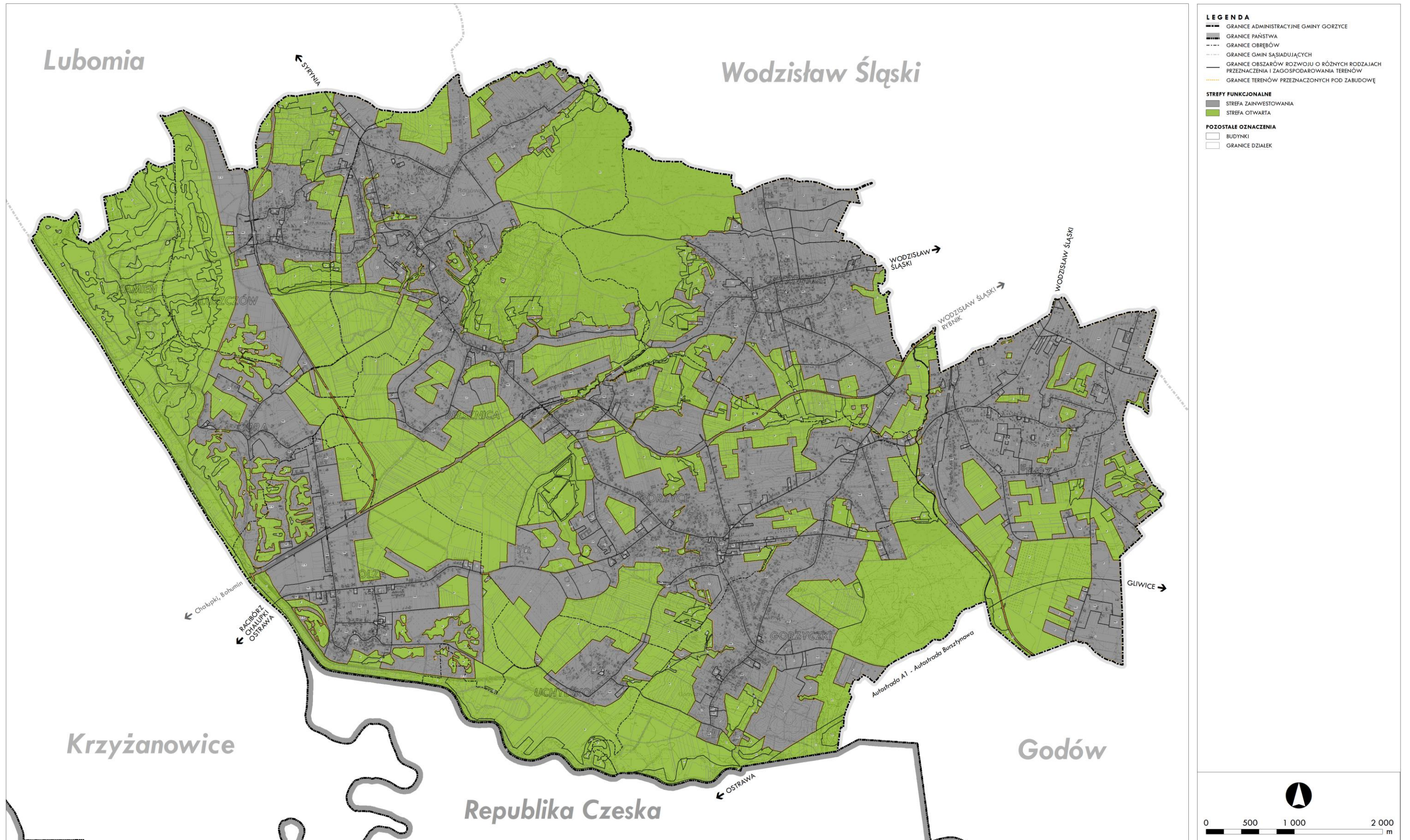
Schemat nr 1. Kierunki zagospodarowania przestrzennego – podział na strefy funkcjonalne; opracowanie własne.