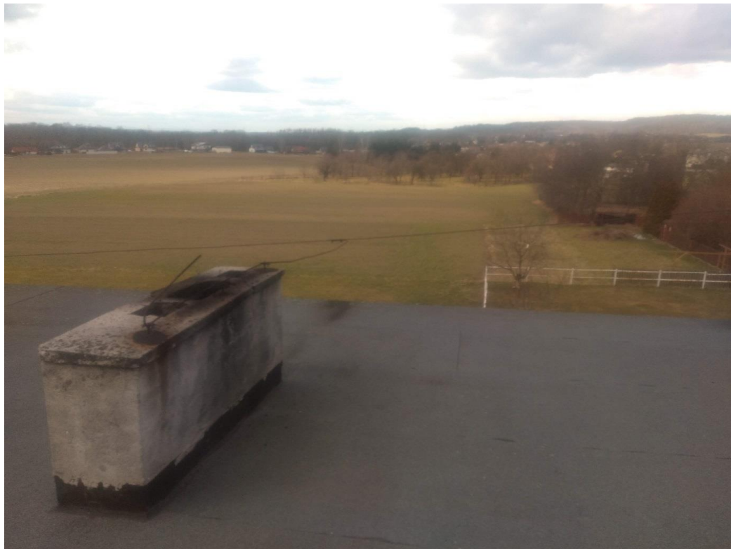
Etap 2. Nad salą sportową

Wymiana betonowej płyty pokrywającej komin o wym 1,5x0,5