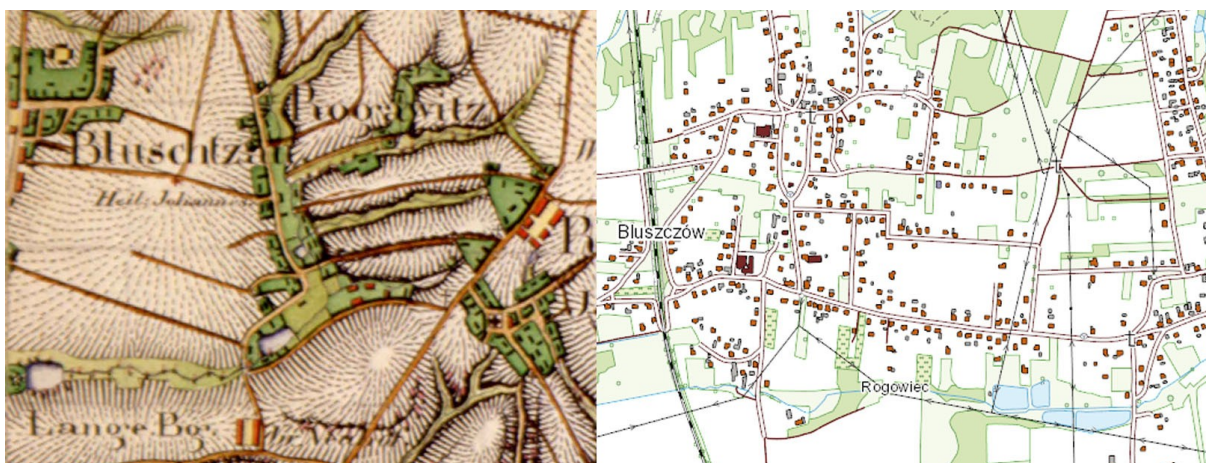
Ryc. 3. Bluszczów: fragment mapy Messtischblatt, 1827 r., skala 1:25000 oraz mapa przedstawiająca stan obecny, skala 1:10000 (podkład www.geoportal.gov.pl ).

Wieś Czyżowice powstała jako wieś o prostym układzie ulicówki, obecna ulica środkowa, z zabudową szczytową, a w drugiej linii zabudową gospodarczą, zamykającą układ siedliskowy. W południowej części widać biegnący równolegle do ulicy potok. Z czasem przy tylnej zabudowie wsi wykształciła się ulica obwodnicowa, która zaczęła nabierać wartości przekształcając wieś z prostego na złożony układ ruralistyczny. Ulica obwodnicowa odpowiada dzisiejszym ulicom Wodzisławskiej i Wiejskiej. Czytelny układ wsi zachował się do czasów współczesnych.