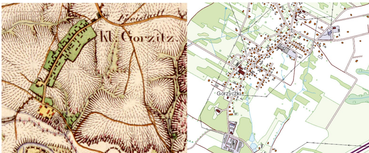
Ryc. 6. Gorzyczki: fragment mapy Urmesstischblatt, 1827 r., skala 1:25000 oraz mapa przedstawiająca stan obecny, skala 1:10000 (podkład www.geoportal.gov.pl ).

Wież Gorzyczki powstała jako wieś o charakterze ulicówki z prostym układem przestrzennym. Na mapie z 1827 r. przy głównej ulicy opasującej wzniesienie widać zabudowę szczytową, a w drugiej linii zabudowę gospodarczą, zamykającą układ siedliskowy. Na południu znajduje się duże założenie folwarczne o charakterystycznej czworobocznej zabudowie z dziedzińcem pośrodku. Folwark jest rozbudowany i posiada mieszaną zabudowę, na południu znajduje się potok co może sugerować obecność młyna. W późniejszym czasie założenie zyskało na znaczeniu – powstał dwór.