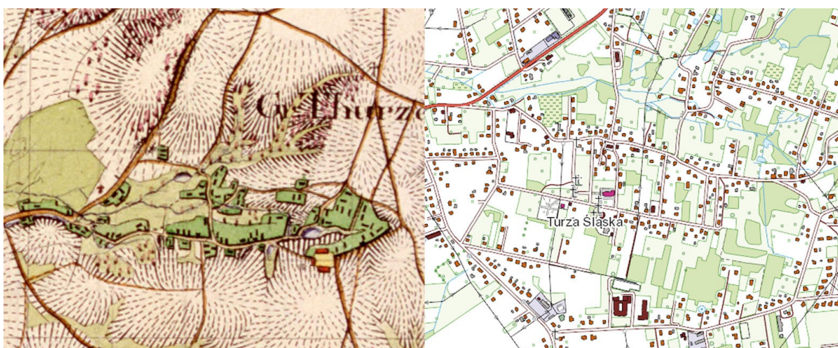
Ryc. 10. Turza Śląska: fragment mapy Urmesstischblatt, 1827 r., skala 1:25000 oraz mapa przedstawiająca stan obecny, skala 1:10000 (podkład www.geoportal.gov.pl ).

Widoczny na mapie z 1827 r. kształt wsi Turza Śląska wychodzi z układu typowej ulicówki, przy której zabudowa lokalizowana jest szczytowo, a zabudowania gospodarcze – kalenicowo, w drugiej linii. Na mapie czytelna jest dzisiejsza ulica Bogumińska, prowadząca na północ do Wodzisławia, na zachód ulica Powstańców. Po widocznych na mapie stawie i folwarku dziś już nie ma śladu.