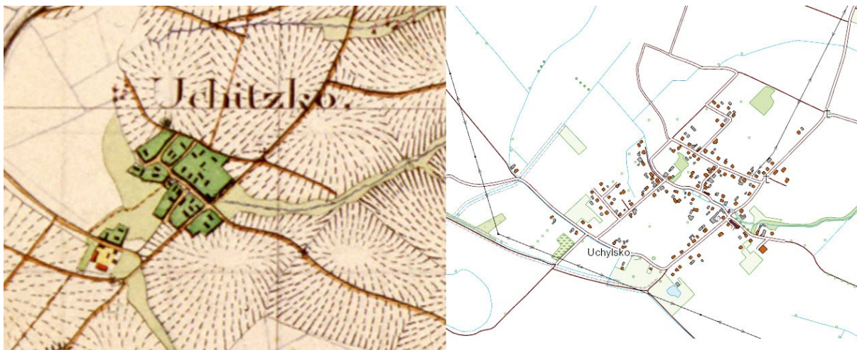
Ryc. 11. Uchylsko: fragment mapy Urmessstischblatt, 1827 r., skala 1:25000 oraz mapa przedstawiająca stan obecny, skala 1:10000 (podkład www.geoportal.gov.pl ).

Architekturę sakralną na terenie gminy Gorzyce reprezentują cztery kościoły w miejscowościach: Gorzyce, Olza, Rogów i Turza Śląska. Świątynie pełnią rolę dominant architektonicznych w obrębie historycznych układów przestrzennych.