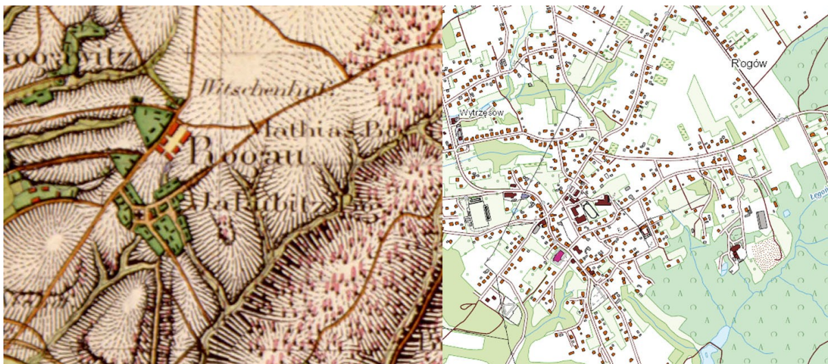
Ryc. 9. Rogów: fragment mapy Urmesstischblatt, 1827 r., skala 1:25000 oraz mapa przedstawiająca stan obecny, skala 1:10000 (podkład www.geoportal.gov.pl ).

Widoczny na mapie z 1827 r. kształt wsi Turza Śląska wychodzi z układu typowej ulicówki, przy której zabudowa lokalizowana jest szczytowo, a zabudowania gospodarcze – kalenicowo, w drugiej linii. Na mapie czytelna jest dzisiejsza ulica Bogumińska, prowadząca na północ do Wodzisławia, na zachód ulica Powstańców. Po widocznych na mapie stawie i folwarku dziś już nie ma śladu.