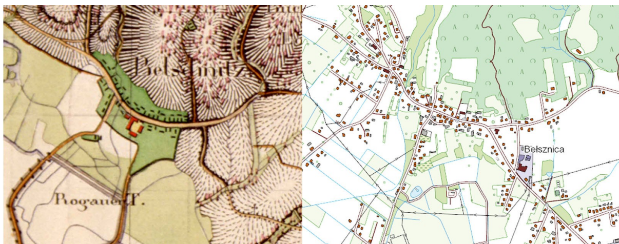
Ryc. 2. Belsznica: fragment mapy Urmesstischblatt, 1827 r., skala 1:25000 oraz mapa przedstawiająca stan obecny, skala 1:10000 (podkład www.geoportal.gov.pl ).

Wieś Belsznica powstała jako wieś o charakterze ulicówki z prostym układem urbanistycznym. Na mapie z 1827 r. przy głównej ulicy opasującej wzniesienie widać zabudowę szczytową, a w drugiej linii zabudowę gospodarczą zamykającą układ siedliskowy. Pośrodku, w południowej pierzei ulicy, znajduje się duże założenie folwarczne o charakterystycznej czworobocznej zabudowie z dziedzińcem pośrodku. Zabudowania ulicy wchodzącej od południa mają charakter kalenicowy. Mogą to być zabudowania gospodarcze bądź mieszkalne, które powstały później niż podstawowy układ wsi.