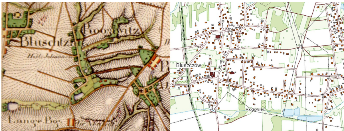
Ryc. 3. Bluszczów: fragment mapy Messtischblatt, 1827 r., skala 1:25000 oraz mapa przedstawiająca stan obecny, skala 1:10000 (podkład www.geoportal.gov.pl ).

Wieś Czyżowice powstała jako wieś o prostym układzie ulicówki, obecna ulica środkowa, z zabudową szczytową, a w drugiej linii zabudową gospodarczą, zamykającą układ siedliskowy. W południowej części widać biegnący równolegle do ulicy potok. Z czasem przy tylnej zabudowie wsi wykształciła się ulica obwodnicowa, która zaczęła nabierać wartości przekształcając wieś z prostego na złożony układ ruralistyczny. Ulica obwodnicowa odpowiada dzisiejszym ulicom Wodzisławskiej i Wiejskiej. Czytelny układ wsi zachował się do czasów współczesnych.