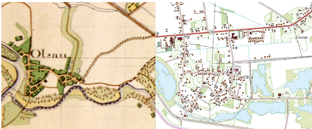
Ryc. 7. Olza: fragment mapy Urmesstischblatt, 1827 r., skala 1:25000 oraz mapa przedstawiająca stan obecny, skala 1:10000 (podkład www.geoportal.gov.pl ).

Kolonia Osiny istniała już na przełomie XVIII i XIX w. Na mapie z 1827 r. widać, że przez kolonię przebiega droga (w innym układzie niż dzisiaj), lecz zabudowa nie koncentruje się wokół niej, ale wokół zalesionego strumienia i stawu. Z dawnego układu Osin nie zachowało się nic. Niemniej zabudowa wzdłuż ulicy Sikorskiego w kilku przypadkach ma cechy zabudowy z przełomu wieków, proces zmian następował przez cały XIX w.