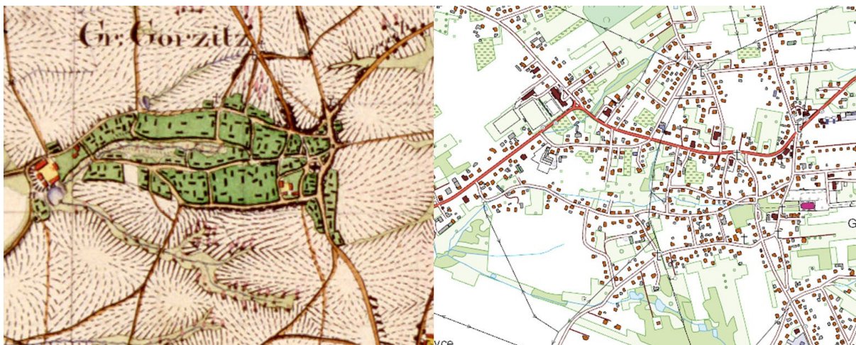
Ryc. 5. Gorzyce: fragment mapy Urmesstischblatt, 1827 r., skala 1:25000 oraz mapa przedstawiająca stan obecny, skala 1:10000 (podkład www.geoportal.gov.pl ).

Wież Gorzyczki powstała jako wieś o charakterze ulicówki z prostym układem przestrzennym. Na mapie z 1827 r. przy głównej ulicy opasującej wzniesienie widać zabudowę szczytową, a w drugiej linii zabudowę gospodarczą, zamykającą układ siedliskowy. Na południu znajduje się duże założenie folwarczne o charakterystycznej czworobocznej zabudowie z dziedzińcem pośrodku. Folwark jest rozbudowany i posiada mieszaną zabudowę, na południu znajduje się potok co może sugerować obecność młyna. W późniejszym czasie założenie zyskało na znaczeniu – powstał dwór.