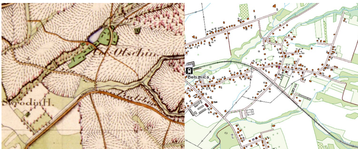
Ryc. 8. Osiny: fragment mapy Urmesstischblatt, 1827 r., skala 1:25000 oraz mapa przedstawiająca stan obecny, skala 1:10000 (podkład www.geoportal.gov.pl ).

Kolonia Osiny istniała już na przełomie XVIII i XIX w. Na mapie z 1827 r. widać, że przez kolonię przebiega droga (w innym układzie niż dzisiaj), lecz zabudowa nie koncentruje się wokół niej, ale wokół zalesionego strumienia i stawu. Z dawnego układu Osin nie zachowało się nic. Niemniej zabudowa wzdłuż ulicy Sikorskiego w kilku przypadkach ma cechy zabudowy z przełomu wieków, proces zmian następował przez cały XIX w.